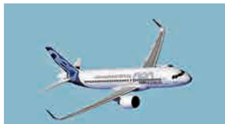
▲A320neo是空中巴士公司的重點機種，可比上一代型號節省約15%燃料

【大公報訊】中銀航空租賃（02588）公布，其全資附屬公司BOC Aviation（Cayman）Limited與空中客車公司訂立協議，中銀航空租賃同意購買18架空客A320neo系列飛機，有關飛機計劃於2022年及2023年交付。