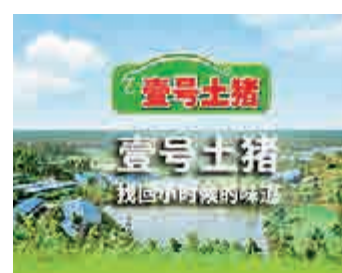
▲壹號土豬是廣東壹號食品的一項主導品牌，產品已遍布全國30多個城市

局，進一步推進品牌的全國戰略。該公司指出，為迎合市場整體發展趨勢，豐富和完善產業鏈，將多元化的健康食品進行到底，公司相繼推出壹號土雞、壹號土鴨、壹號烏雞、壹號土豬水餃、壹號土豬雲吞、壹號土雞蛋