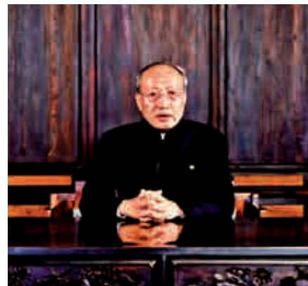
▲海航集團董事長陳峰在2020年新年獻詞中提到，要貫徹落實好化解流動性風險的整體方案 視頻截圖

「遵義會議是中國革命從挫折走向勝利的偉大轉折，2019年我們在遵義召開了會議，進一步明確了海航的發展戰略、方向，海航也將迎來化解流動性風險的大轉折。我們相信，海航的事業是造福於天下人的事業，我們能夠取得成績和戰勝困難，靠的是