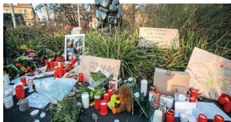
▲當地民眾1日為悼念遇難猴猴，在動物園門口擺滿蠟燭和鮮花

亮點，園方在臉書專頁上宣布：「我們最害怕的事情成真了。」淚流滿面的遊客周三紛紛在動物園入口處點燃蠟燭，並留下花束及絨毛玩偶。 初步調查顯示，這起火災可能是由飛行的紙天燈引發。調查人員在火災殘跡中發現3盞天燈，上面有手寫的新年願望。當地從2009年起就禁止施放這類物品，警方已針對「過失縱火」展開調查，一些可能使用過這些天燈的民眾周三主動聯繫警方。警方表示，將查證他們的供詞。 克里菲德動物園呼籲禁止在動物園、農場及犬舍附近施放各種煙花，表示這場致命大火是「不受控的慶祝活動」對動物造成嚴重後果的殘酷證明。此外，煙花對空氣質量的影響在德國也引發爭議。