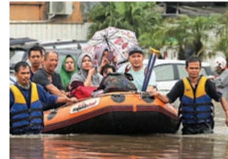
▲雅加達救援隊1日援救被洪水困住的災民