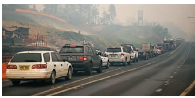
▲新州將進入緊急狀態，車輛2日排隊駛離巴特曼斯貝鎮

【大公報訊】綜合澳洲ABC新聞、《世紀報》、法新社報道：澳洲正經歷迄今破壞性最強山火季節，山火持續燃燒、火場不斷擴大，已造成18人死亡。預計周六又將有另一波熱浪、強風席捲澳洲全國，預料將會為失控的山火情況火上澆油。新南威爾士州再次宣布從3日起進入緊急狀態，當地人和遊客緊急撤離；另一邊，維多利亞州援救「煉獄海灘」被困者行動正緊急進行中。