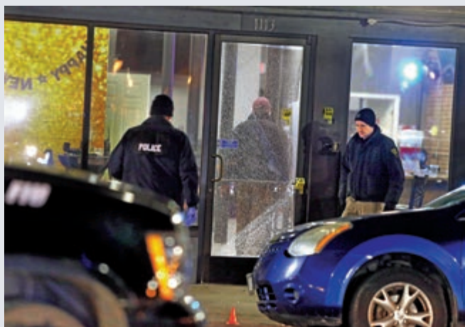
▲1日美國一間酒吧發生槍擊，警方到現場調查

2019年美國大型殺人案件數創下歷史紀錄，其中多數為槍擊案，專家稱美國步入「大規模槍擊時代」。《紐約時報》報道稱，對於一個對槍支暴力「習以為常」的國家來說，充斥槍聲和鮮血的元旦，似乎可以稱得上是典型的「美國式新年開端」。