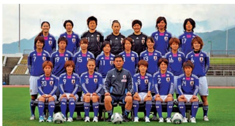
▲日本女足國家隊將負責傳遞首棒東奧聖火

據報道，開幕式的表演可能將運用動漫傳遞「休戰」訊息，在國際形勢前景不明朗的情況下，簡明易懂地彰顯通過體育爭取和平的奧運精神。