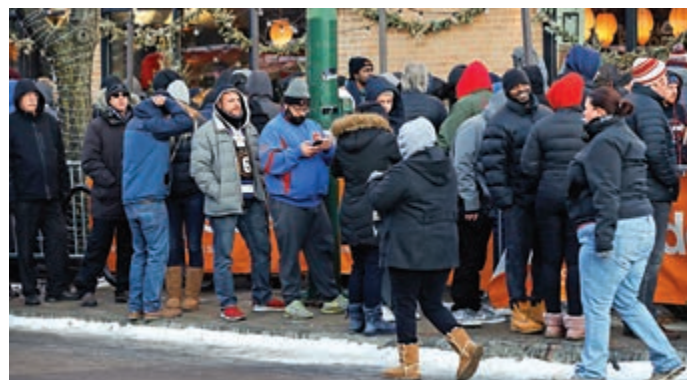
▲伊州芝加哥民眾1日排隊購買大麻

目前美國11個州及華盛頓特區已將娛樂用大麻合法化，但美國緝毒局仍認定大麻與迷幻藥LSD及海洛因同屬危險物質。