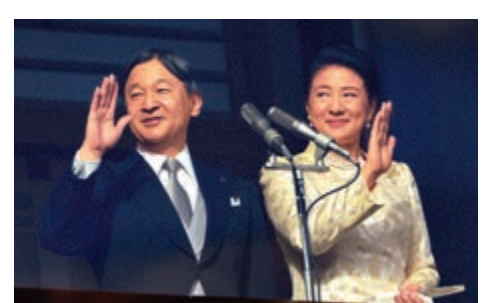
▲日皇德仁（左）與皇后雅子2日向民眾揮手

當天的參賀分上午及下午合共5次進行。日皇德仁與皇后雅子、上皇明仁與上皇后美智子、皇嗣秋篠宮伉儷與兩位女兒等成年皇族站在宮殿「長和殿」的陽台接受民眾賀年。大家面露笑容，揮手向民眾致意；民眾則揮舞手上的國旗並歡呼。這是上皇明仁夫婦在退位後首次與日皇夫婦同場。