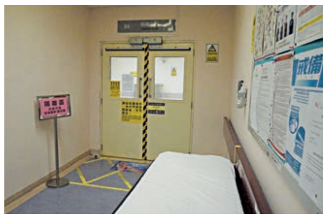
▼兩週內由武漢抵港人士如有任何病徵，會立即送往公立醫院接受隔離