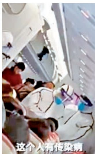
▲武漢天河機場核實有關武漢肺炎病人乘坐飛機赴港的視頻，為不實信息

武漢天河機場在官方微博回應稱，機場方面迅速組織排查，經多方核實，武漢天河機場及各航空公司均未發現該帖所稱的疑似傳染病人乘機，也無視頻中出現的航班。該視頻為不實信息，武漢天河機場已報公安機關調查處理。