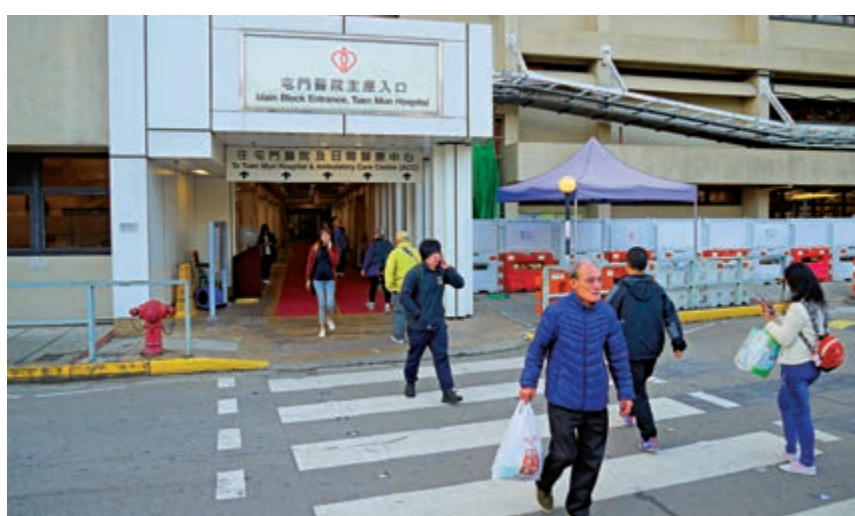
▲衛生防護中心收到三宗通報不明肺炎個案，分別來自屯門、瑪嘉烈及大埔那打素醫院