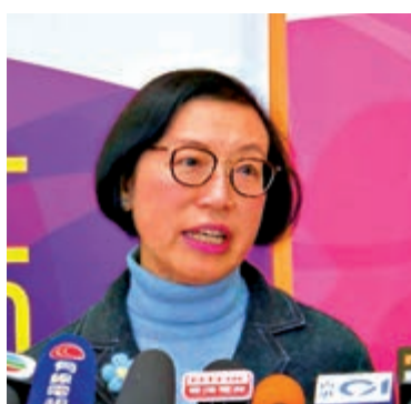
▲陳肇始表示本港目前並無任何與武漢肺炎相關個案