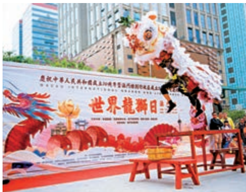
▲1月1日，世界龍獅日澳門站在友誼廣場舉行，吸引不少遊客駐足觀看

據了解，現在赴澳門遊客參加美食購物、家庭團聚、旅遊會議、科技等活動的越來越多。數據顯示，現在澳門航空女性乘客佔45%；18歲以下的乘客佔2成。可見，澳門除了當地經濟也呈現多元化發展，遊客結構也發生明顯變化。