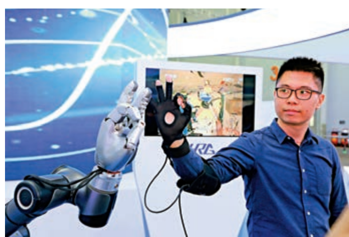
▲去年9月在佛山舉辦的珠洽會上展出的「款機械手」可同步模擬人手動作

2019年中國國內生產總值預計接近100萬億元，此次「躋身萬億俱樂部」意味着，佛山僅用全國萬分之四的土地，創造了近1%的生產總值，是廣東經濟高質量發展的有力詮釋。