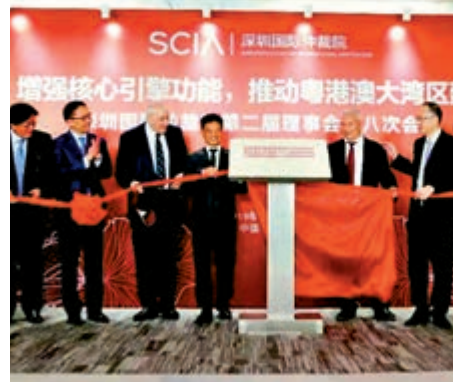
▲廣東1日出台新規推動多元化解涉粵港澳跨境商事糾紛

色，不僅借鑒了香港、澳門商事調解的通常方法，為調解廣東自貿區內涉粵港澳跨境商事糾紛提供了更多渠道和更大空間，還為香港、澳門法律專業人士參與調解粵港澳跨境商事糾紛提供了遵循和便利，有利於促進粵港澳三地商事調解規則的銜接和聯通。