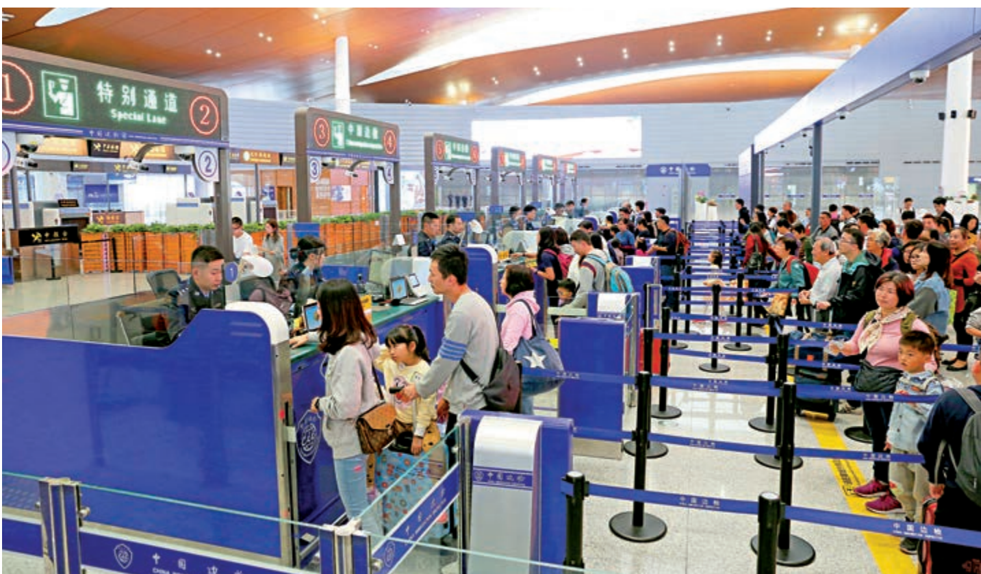
▲珠海邊檢總站2019年共查驗出入境人員首次突破1.73億人次

珠海邊檢總站有關負責人表示，年內珠海邊檢總站在港珠澳大橋珠海公路口岸新建邊檢自助查驗通道37條，優化升級各口岸邊檢自助查驗通道200餘條，進一步提高口岸通關效率。目前使用邊檢自助查驗通道出入境的旅客達到近八成，同比增長約16.6%，即有1.36億旅客暢享「秒通關」的便利。