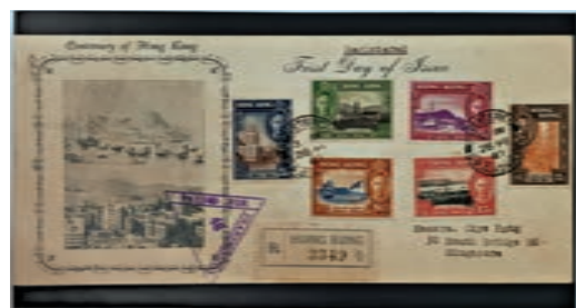
▲1941年香港開埠百周年首日封