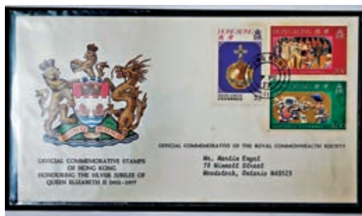
▲1977年英女王銀禧紀念郵票