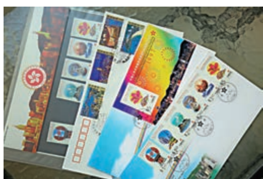
▲回歸紀念郵票及首日封