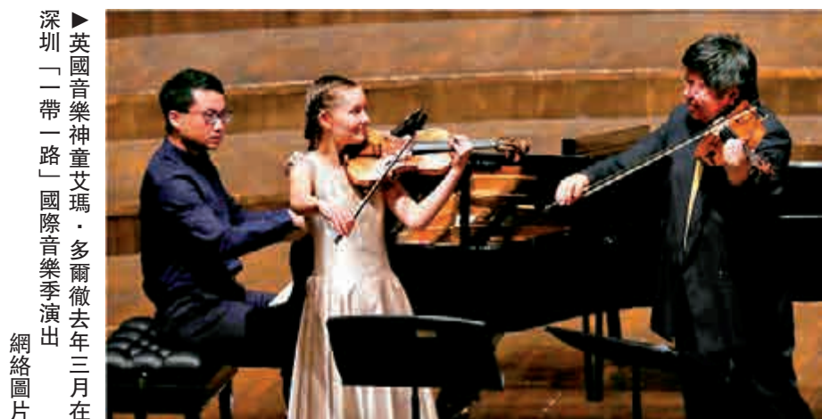
▲英國音樂神童艾瑪·多爾徹去年三月在「一帶一路」國際音樂季演出