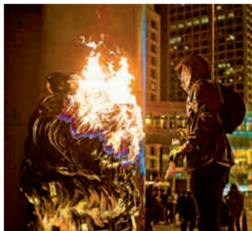
▲羅致光網誌指出，暴徒火燒滙豐銀行銅獅子，令人神傷