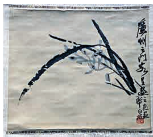
▲齊白石在廣州時創作的《墨蘭》