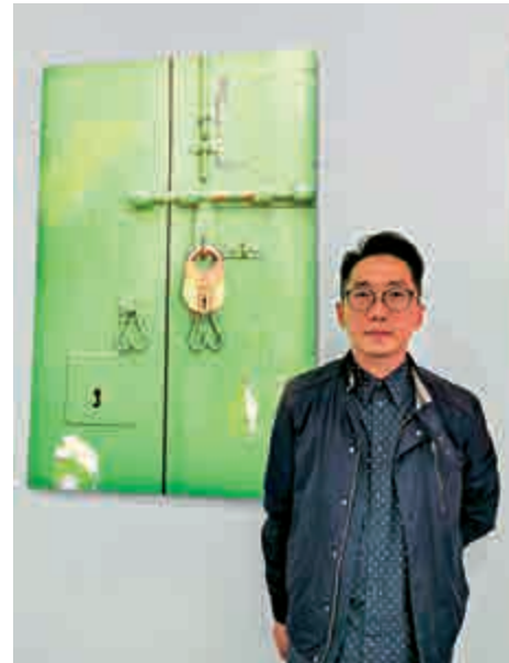
▲攝影師張偉廣鍾愛香港的小巷