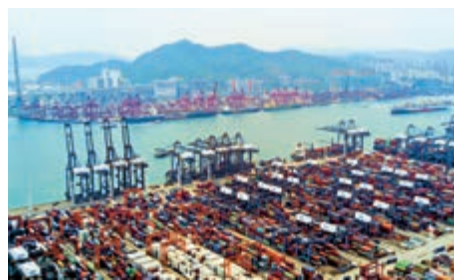
▲本港新接訂單量於12月繼續萎縮

前行，香港私營經濟在2019年尾聲處於極度低迷。「PMI第四季度平均值反映GDP下跌5%左右，而經濟衰退於2019年末季亦見加劇。」他進一步說，隨著新接訂單量於12月繼續萎縮，企業的營商信心仍處歷史低位；而在蒙陰的前景下，企業再度大幅縮減採購活動和庫存水平。