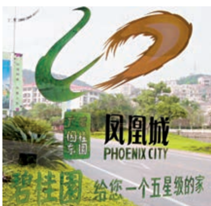
▲碧桂園去年錄得合同銷售金額約5522億元，增加10.3%

31.46%。大發地產（06111）公布，2019年實現累計合同銷售金額約為210.17億元；累計合同銷售面積約為155.11萬平方米；平均銷售價格為每平方米約13550元。