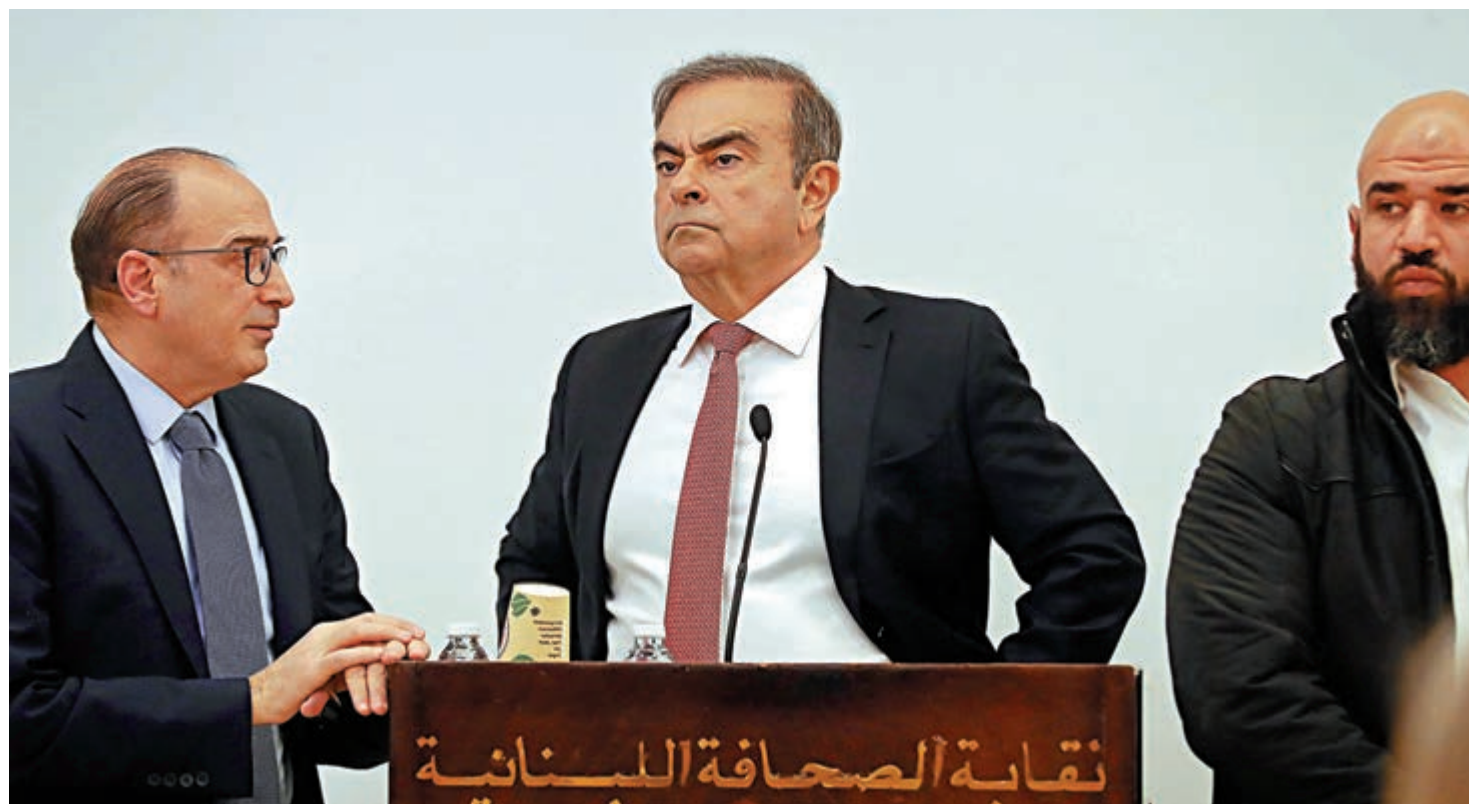
▲戈恩（中）8日舉行記者會