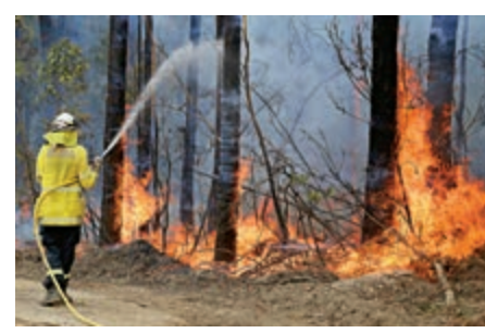
▲一名澳洲消防員8日在新南威爾士州滅火

聯合國世界氣象組織證實，大火產生的煙霧已抵達南美洲，有機會已經抵達南極。智利和阿根廷6日就表示能看到煙霧，巴西國家太空署旗下遙測部門7日也表示，山火煙霧到達巴西。