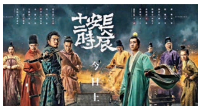
▲《長安十二時辰》投資額高

去年開始，網劇又呈現出新的生態。兩部熱播網劇《長安十二時辰》與《慶餘年》，都是叫好又叫座。《長安十二時辰》以高額的投資，真實生動地再現了唐朝風貌；《慶餘年》則雲集了內地影視界一批資深的演員，其正劇規格的製作和陣容，意味着網劇正式被主流所接納，成為未來「國劇」發展的重要力量。