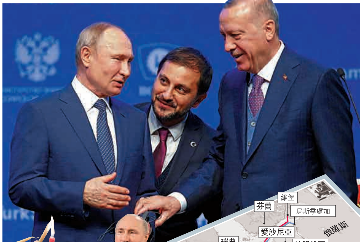
▲埃爾多安（右）與普京（左）8日在翻譯（中）陪同下出席「土耳其溪」管道開通儀式。美聯社

【大公報訊】綜合美聯社、路透社及新華社報道：新年伊始，俄羅斯總統普京先後訪問敘利亞和土耳其，7日在大馬士革與敘利亞總統巴沙爾舉行會談，8日又在伊斯坦布爾，與土耳其總統埃爾多安共同出席「土耳其溪」天然氣管道通氣儀式。有分析指，普京此行表明，俄羅斯在新的一年裏將繼續打「中東牌」，並以此為突破口，加速實現本國發展戰略。