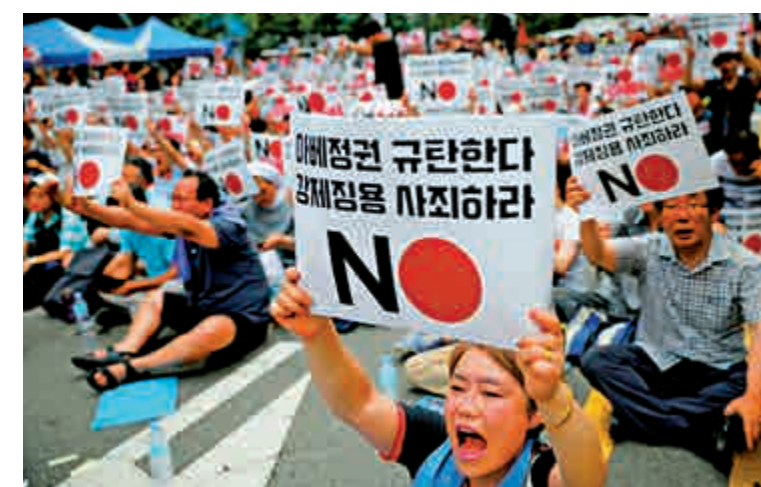
▲韓國示威者高舉「向戰時勞工道歉」的條幅，要求日方作出賠償。

大田地方法院批准扣押日本三菱重工在韓資產；同年5月，遭強徵勞工一方向法院申請變賣涉日企資產，日方提出外交抗議。隨後，韓國外交部提議共同出資賠償勞工，又遭到日方拒絕。