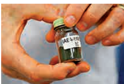
▲美能源部決定開放高濃縮鈾出口。圖為鈾樣本

比利時核設施過去曾發生安全問題。2014年，一名罪犯把一座反應爐的潤滑劑排掉，導致電廠關閉，損失2億美元；2016年，布魯塞爾自爆的恐怖分子曾偷拍比利時核研究計劃負責人的行動。