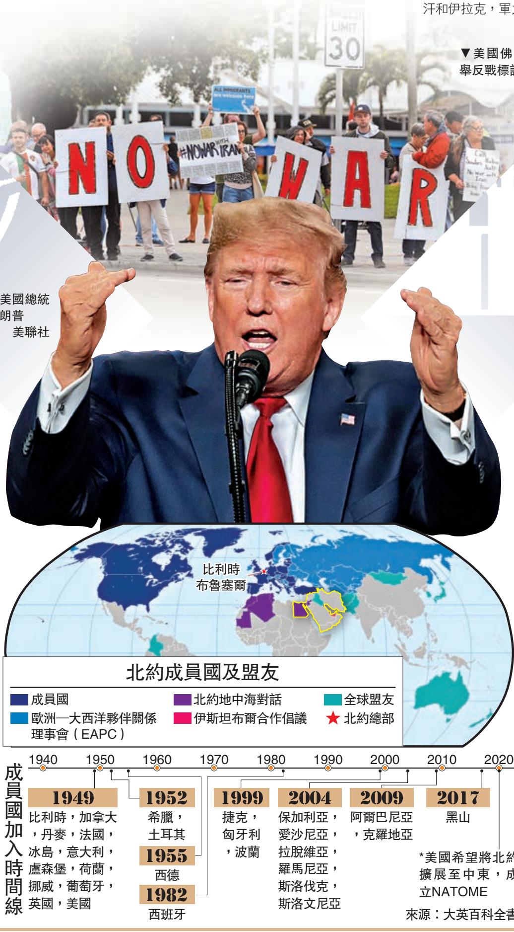
美國總統特朗普

董漫遠估計，如果美伊能回到談判桌邊，還是有可能達成一個折衷方案，但這將會是曠日持久、充滿曲折的談判。