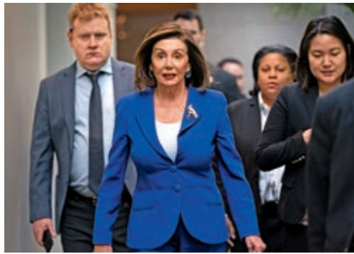
美國眾議院議長佩洛西

另外，佩洛西表示，不久後可能會將彈劾條款送至參院進行後續審判。她此前為了威脅參議院制定規則，公平審判特朗普，而將彈劾條款扣留數周。但參院日前修改章程，規定眾院需在彈劾條款通過後25天內（即1月12日之前）交由參院，否則就失去效力。