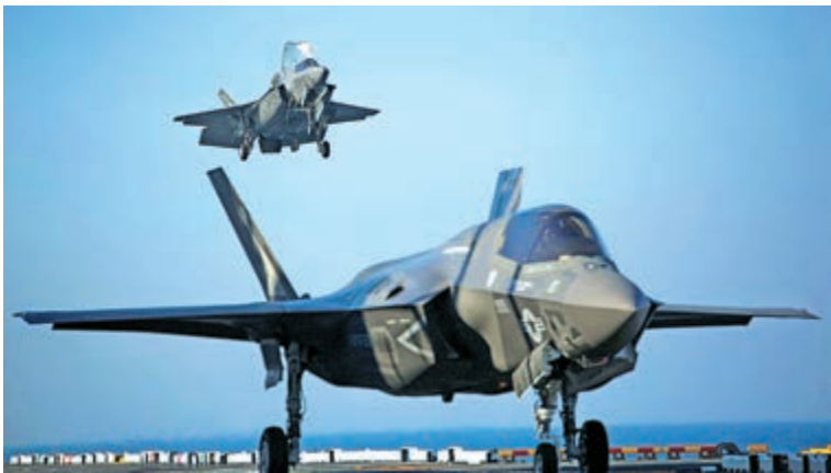
▲美國國務院批准出售12架F-35B給新加坡

【大公報訊】綜合法新社、《聯合早報》：美國國防安全合作署（DSCA）10日表示，美國國務院已批准出售新加坡多達12架F-35B戰機及相關設備，估計價格達27.5億美元（約214億港元），國會將在30天內做出最終定奪。國會通過後，新加坡就將成為第12個擁有F-35隱形戰機的國家。