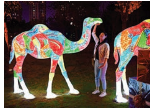
▲深圳歡樂谷的夜間娛樂十分豐富

歡樂谷全新陽光海岸是以國產原創動漫IP「餅乾警長」為文化核心打造的休閒主題區，當中設施包括雙跳台高空蹦極、沙灘無動力親子遊樂區「餅乾警長訓練營」。高空蹦極適合喜歡挑戰的年輕人，他們可以從近二十層樓高的雙跳台上一躍而下，兩秒到達最低點，以飛鳥般的視角俯瞰濱水大地；至於訓練營則針對家庭遊人的娛樂需求，園方打造了巨型沙灘遊樂場，攀爬網牆、穿越隧道、迷你滑梯、打擊樂器……式式俱備，老少咸宜。