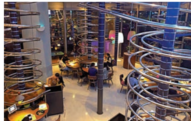
▲「失重餐廳」以大型軌道送餐