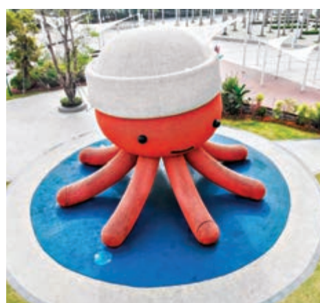
▲大章魚堡由纜繩編製，可供小朋友攀爬

地址：深圳海景二號1032號附近 交通：地鐵1號線至大劇院站落車，轉乘公M191至鹽田區政府站後，步行506米即達