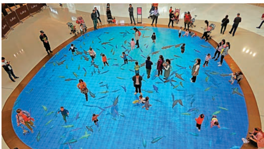
▲LED互動地屏上可見到不同的海洋生物

被深圳居民視為新地標的大仨里購物中心於上月底開幕，超多玩樂飲食等元素被引入，集購物、休閒、娛樂、餐飲、文化於一身，不少遊人紛紛前往「朝聖」。商場門口有一座大型黑熊貓塑像坐鎮，吸引不少路過的人合照一番。在這裏，絕對能夠玩足一日。