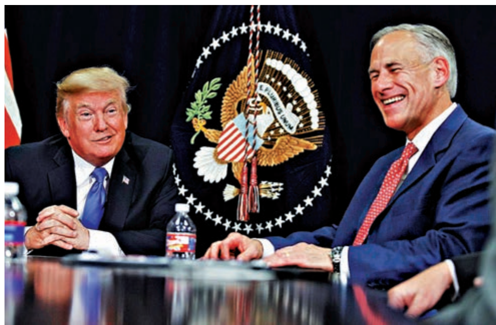
◀ 美國得州州長阿博特（右）與總統特朗普