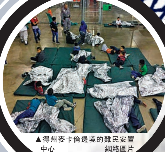
▲ 得州麥卡倫邊境的難民安置中心 網絡圖片