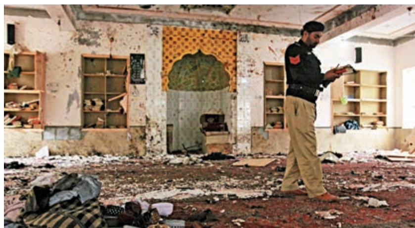
◀ 巴基斯坦奎達市警員11日在清真寺爆炸彈襲擊現場