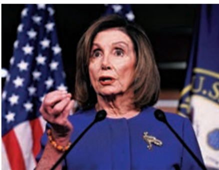
▲ 美國眾議院議長佩洛西10日表示下周將把彈劾特朗普條款送交參議院

過去三周裏，佩洛西數次拒絕將彈劾案移交參議院。專家分析，拖延是迫使參議院多數黨領袖麥康奈爾作出讓步的策略，原因是她希望參議院同意在審判中納入新的證人證詞和證據。而共和黨則希望盡快「了結」彈劾案，麥康奈爾9日簽署決議案，規定眾議院如果未能在25日內向參議院提交彈劾條款，彈劾將被撤銷。