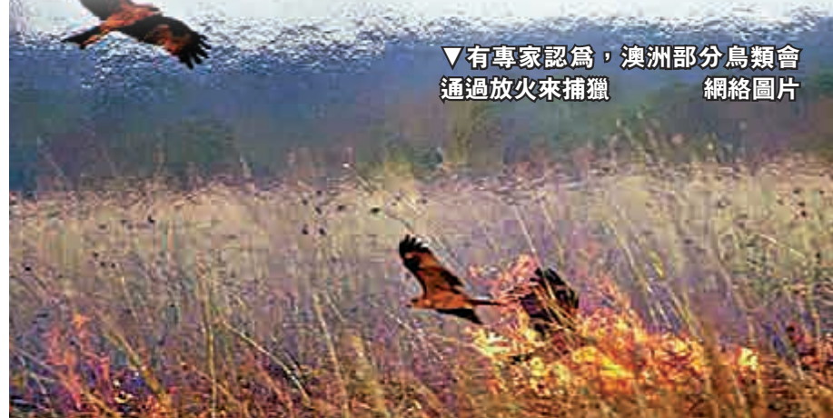
▼有專家認為，澳洲部分鳥類會通過放火來捕獵

研究人員現正尋找世界各地，特別是非洲、美洲等地的類似報告，但強調尚不清楚鳥類「縱火」的行為有多普遍，或者是否真實存在。目前為止，還沒有確切的影像或視頻資料能夠證明澳洲鳥類在「縱火」。