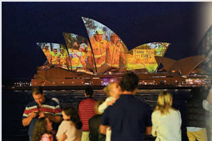
▲悉尼歌剧院外牆11日放映消防員救火場景，以示感恩 ▲環保組織贈送澳總理府以灰燼取代雪花的水晶球