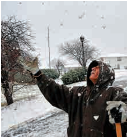
▲美國多州近日出現暴風雨雪天氣

flightaware.com網站則顯示，單是在芝加哥奧黑爾國際機場，就有超過1000航班被取消，數以百計航班受到延誤，大量旅客滯留。