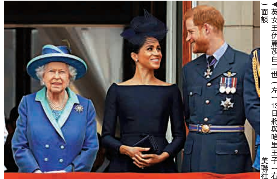
▲英女王伊麗莎白二世（左）13日將與哈里王子（右）面談

此外，《星期天泰晤士報》報道，威廉王子向友人表示，他對於弟弟的決定相當痛心，「我們是分開的實體，我很難過。」但據稱威廉也對弟弟的決定表達尊重，但希望王室每個人都要履行自己的責任。