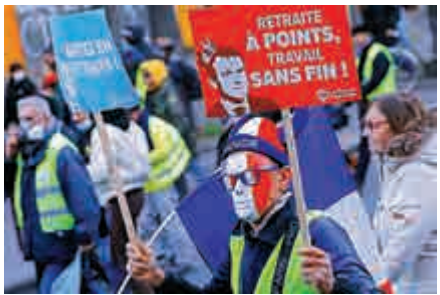
▲抗議退休改革的示威者11日走上巴黎街頭

但強硬派工會CGT拒絕了政府的提議，批評其只是「煙幕」，要求政府撤回整套改革方案，並號召會員在未來一