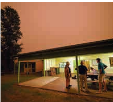
▲新南威爾士州天空布滿山火造成的煙霾