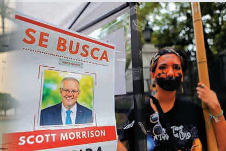
▲示威者在澳洲駐阿根廷使館外舉起對莫里森的「通緝令」，批其救災不力