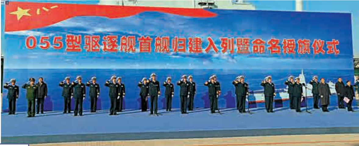
▲1月12日，中央軍委機關有關部門、海軍和南昌市、青島市領導，部隊官兵代表等參加南昌艦入列儀式

112單元通用導彈垂直發射系統（前段），估計可發射紅旗-9防空導彈、紅旗-16防空導彈、鷹擊-18反艦導彈、鷹擊-83反艦導彈和長劍-10巡航導彈