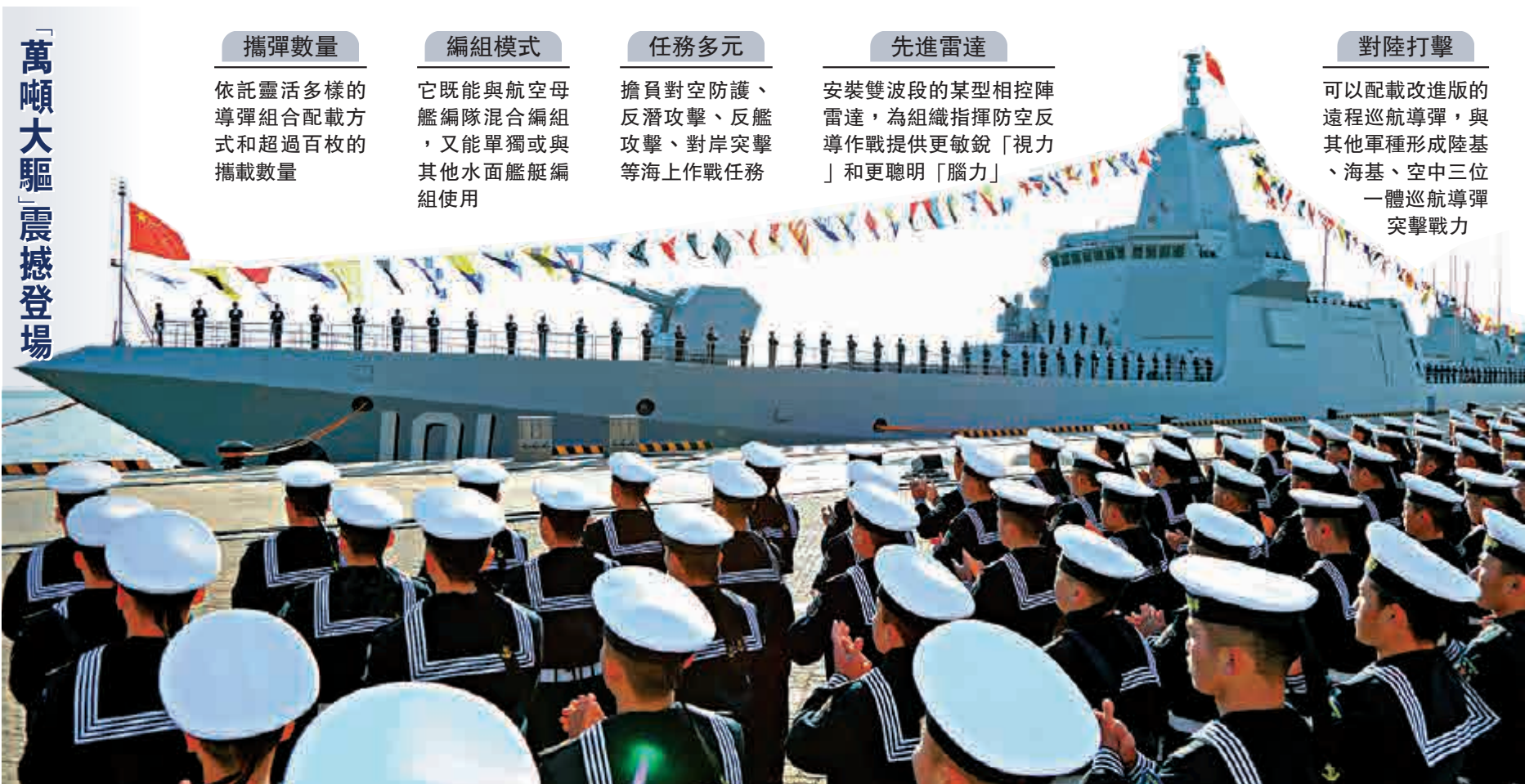
「萬噸大驅」震撼登場

知名軍事專家杜文龍早前在接受央視採訪時曾表示，從055型驅逐艦的建造速度來看，未來應該會出現雙航母加四艘055型的搭配。他說，055型在排水量和綜合能力方面，不光是中國領先，在全球範圍內也屬領先，並真正實現了一艦多能、一艦多用。 知名軍事問題專家、鳳凰衛視評論員宋忠平指出，055型的強大的續航能力、超強大的打擊能力以及非常強大的區域防空能力，可成為未來的海上尖兵以及航母的最佳「帶刀侍衛」和拍檔。055型將讓中國的海軍能夠走得更遠，從近海、遠海走向遠洋，讓中國的海軍能夠踐行遠海護衛，變成戰略海軍、藍水海軍。