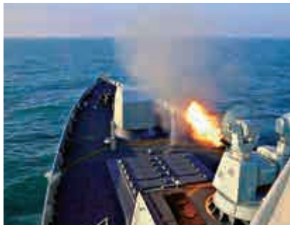
▲廈門艦副炮對遠處的靶機進行射擊

報道，該旅課目設置不僅更加聚焦實戰，而且更加注重發揮各級指揮員的表率作用，他們或駕機領飛，或在塔台指揮，或第一個做戰術動作，用「看我的、跟我上」，引領部隊掀起新年度訓練熱潮。開訓以來，該旅官兵士氣高漲，刻苦訓練、苦練精飛，練精練強作戰技能。