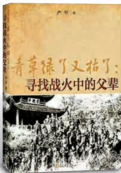
►嚴平著《青草綠了又枯了：尋找戰火中的父輩》，人民文學出版社，二〇一九年