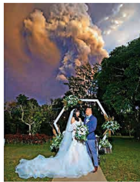
▲一對新人12日以爆發的火山為背景，完成了婚禮

婚禮期間，塔爾火山開始爆發，但儀式並未被終止，攝影師埃文表示，其實婚禮工作人員一直非常緊張，不斷查看社交媒體上有關塔爾火山爆發的最新消息，因此他們當時已得知政府發出火山爆發警告，並上調警戒級別。但參加婚禮的賓客始終保持冷靜。負責舉辦婚禮的農場則在社交媒體上傳新人的照片，並配文宣布：「婚禮繼續！」