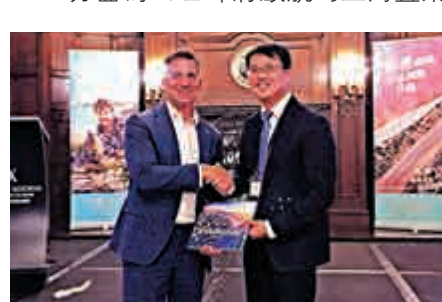
▲西澳旅遊局與上海市文旅局代表互贈禮物

珀斯季節性航班做準備，另一方面，也去了上海綠地申花足球俱樂部，歡迎申花球隊前往珀斯參加亞冠聯賽小組賽。