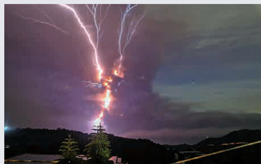
▲塔爾火山爆發時伴有閃電，場面十分震撼

【大公報訊】綜合美聯社、CNN及新華社報道：12日下午1時，菲律賓旅遊勝地大雅台附近的塔爾火山開始噴發，火山灰高達10至15公里，超過45萬人受影響需要撤離。火山灰影響首都馬尼拉，馬尼拉國際機場一度關閉，馬尼拉市長莫雷諾(Isko Moreno)也受影響一度滯留香港國際機場。中國駐菲律賓使館12日發出領事保護公告，提醒中國公民注意安全，及時遠離危險地區，並警惕火山灰造成的傷害。