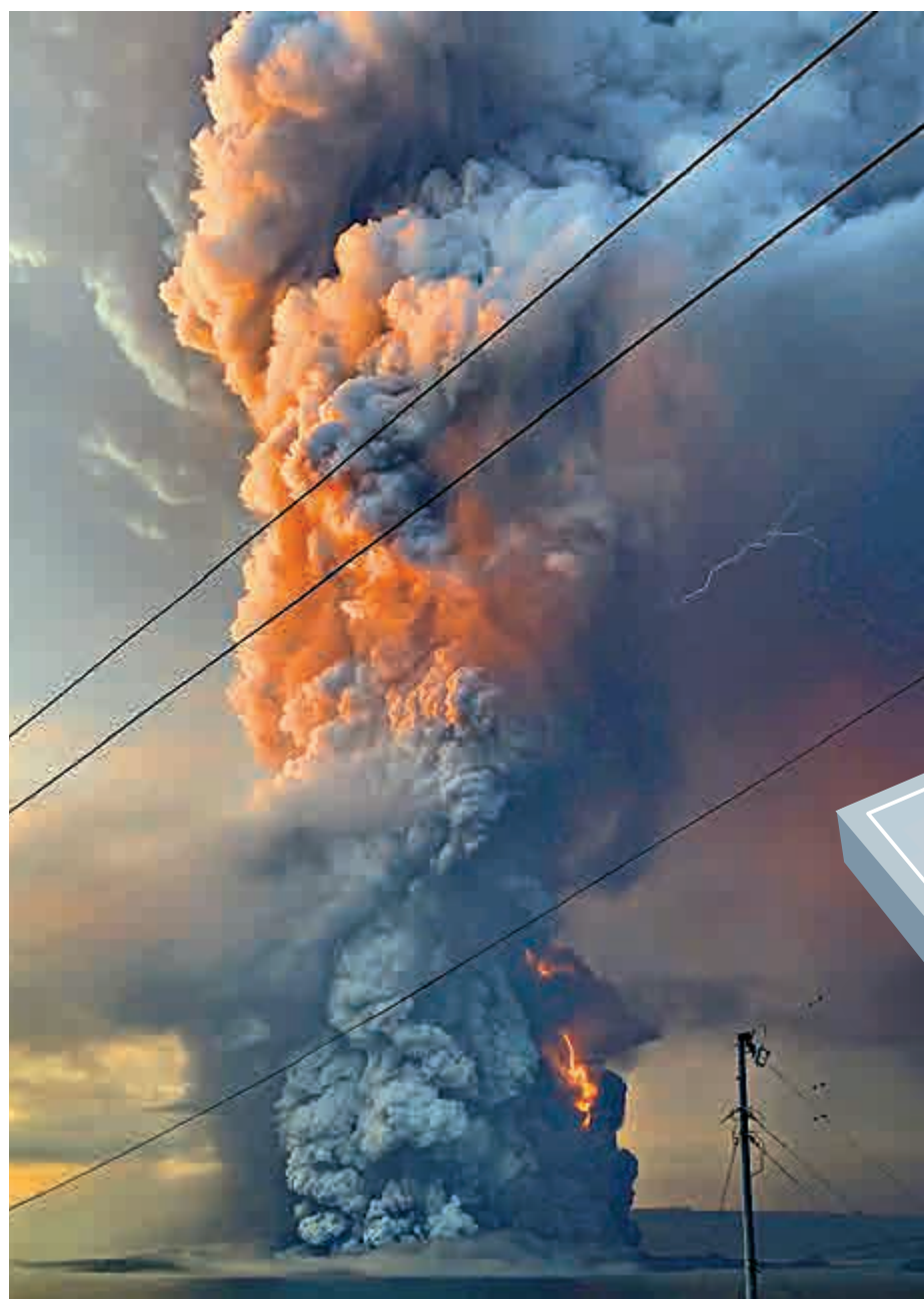
▲塔爾火山12日爆發，火山灰遮天蔽日