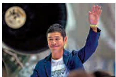
▲前澤友作將成為SpaceX繞月之旅的首位民間乘客

前澤友作的感情經歷十分豐富，曾與兩名女子誕下3個兒子，不久前才與27歲日本女演員剛力彩芽分手。他近日因在推特上給粉絲發福利成為話題人物，他計劃給1000名粉絲每人100萬日圓(約7萬港元)，稱是進行一項嚴肅的社會試驗，來探究「錢是否能買來幸福」。