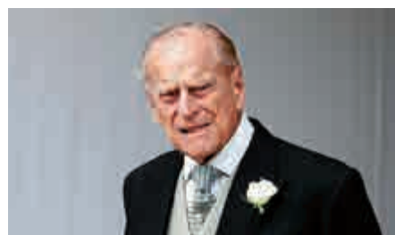
▲英媒稱菲臘親王怒斥哈里夫婦不尊重女王

哈里與梅根8日宣布要退至幕後，未來要在英國和加拿大兩地居住，還表示要財務獨立。然而，據傳兩人在公布消息前沒有和女王伊麗莎白二世商議。女王13日在桑德靈厄姆莊園召開緊急秘密會議，與哈里面談，查爾斯王子及威廉王子也到場，共同商討解決方法。