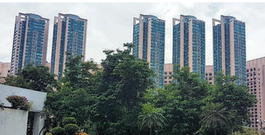
▲青衣藍澄灣3房戶兩個月跌價13%

原業主2007年12月以182萬元（未補地價）購入，持貨逾12年帳面獲利541萬元或近3倍。