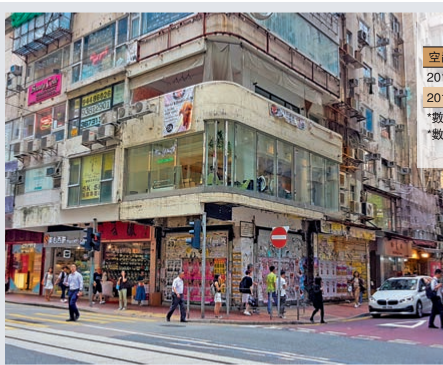
▲銅鑼灣主要街道的地舖空置率升幅驚人

舖租下跌，舖價亦難幸免。消息指出，上環仔沙街8號地舖，地下面積565方呎，閣樓面積465方呎，合共1030方呎，去年叫價3500萬元，多番劈價剛以2200萬元沽出，減幅達37%。舖位由餐廳以每月約6萬元租用，回報率約3.3厘。