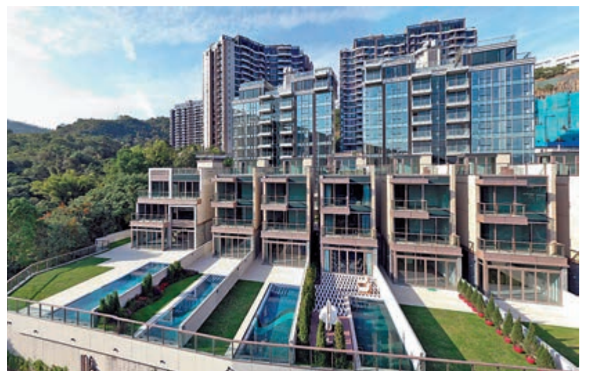
▲富豪·山峯獨立屋沽近一點一七億元創項目新高

另邊廂，中信泰富馬鞍山峻源昨日連沽3伙。成交紀錄冊顯示，單位為2座11樓C室、19樓A室及C室，實用面積1185方呎及1194方呎，同為3房套房間隔，成交價1916萬至2068萬元，呎價16047元至17345元。項目去年9月開賣至今累售31伙。