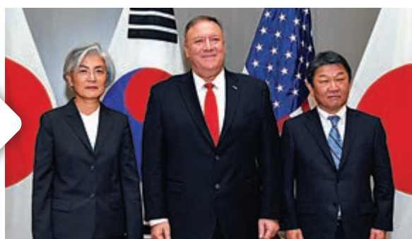
▲（從左至右）韓國外長康京和、美國國務卿蓬佩奧和日本外務大臣茂木敏充14日在美國三藩市會晤

另一方面，美國國防部部長埃斯珀14日在華盛頓與日本防衛大臣河野太郎舉行會談，一致同意在即將迎來《日美安全保障條約》簽署60周年之際，加強日美同盟威懾力與應對能力。