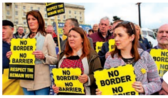
▲愛爾蘭民眾反對愛爾蘭與北愛爾蘭出現硬邊界