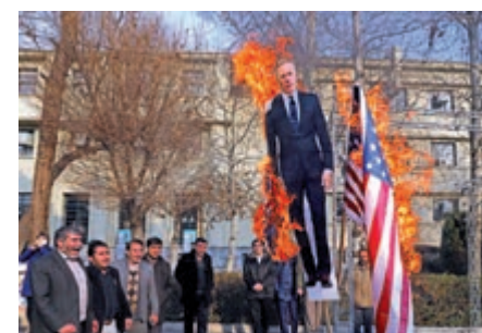
▲伊拉克示威者14日點燃美英國旗及英國駐德黑蘭大使馬凱爾的人形立牌

自2017財年以來，美國每年出資2.5億美元支持伊拉克購買美國軍事裝備，並為伊方培訓、國防建設工作提供資金。此外，伊拉克什葉派領袖薩德爾（Moqtada al-Sadr）14日發推文抗議美軍留駐伊拉克，「伊拉克的天空、土地和主權每天都遭到駐軍侵犯」。薩德爾號召伊拉克民眾響應「百萬和平團結聯合示威，譴責美軍的侵犯行為」。報道指出，對政府施壓的遊行可能於17日舉行。