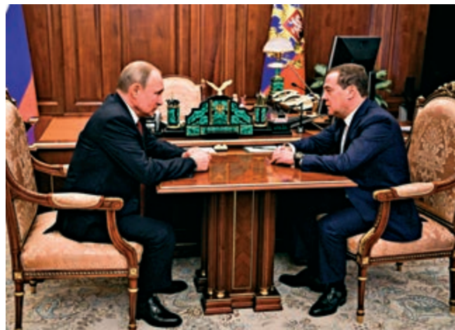
▲俄羅斯總統普京（左）與總理梅德韋傑夫15日在莫斯科會面

普京隨後表示，他打算增設俄聯邦安全會議副主席一職，並提議梅德韋傑夫出任此職，主管國防和安全。俄羅斯聯邦安全會議主席由俄羅斯總統兼任，帕特魯舍夫為該機構秘書。