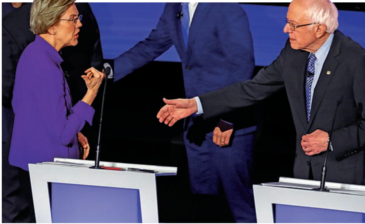
▲14日辯論結束後，沃倫（左）拒絕與桑德斯握手

【大公報訊】綜合美聯社、《華盛頓郵報》、《衛報》報道：美國民主黨初選第7輪辯論，即最後一場選前辯論14日晚在艾奧瓦州首府得梅因舉行，6名候選人展開兩小時激烈攻防。除醫保、教育、氣候變化等傳統議題，以及因當前美伊關係緊張而備受關注的外交政策外，因桑德斯和沃倫日前因性別歧視言論發生爭論，性別議題意外成為當晚辯論焦點，沃倫更在辯論結束後拒絕與桑德斯握手。