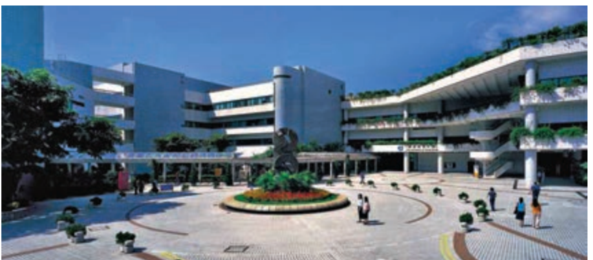
▲城大下學年將推出彈性收生新安排，避免專才流失

城大指出，新彈性收生安排涵蓋九個學院，其中以工學院、理學院、數據科學學院及能源及環境學院四個學院的獎學金分數要求最低，僅需要26分，而最高則為賽馬會動物醫學及生命科學院的獸醫學士課程的32分。其他學院則有商學院、人文社會科學院、創意媒體學院要求27分，賽馬會生物醫學系成績要求為27分，法律學院要求31分。較城大去年一科低於指定要求，其他五科取得平均5*級成績可獲考慮Band A課程申請的政策，今年新彈性收生適用於將相關學院的課程列於A組別且面試表現良好的申請人。對於申請修讀工學院課程的學生，須在兩個與STEM有關的科目中取得良好成績(生物、化學、物理、數學、數學延伸部分M1或M2、組合科學、綜合科學、資訊及通訊科技、設計與應用科技)。