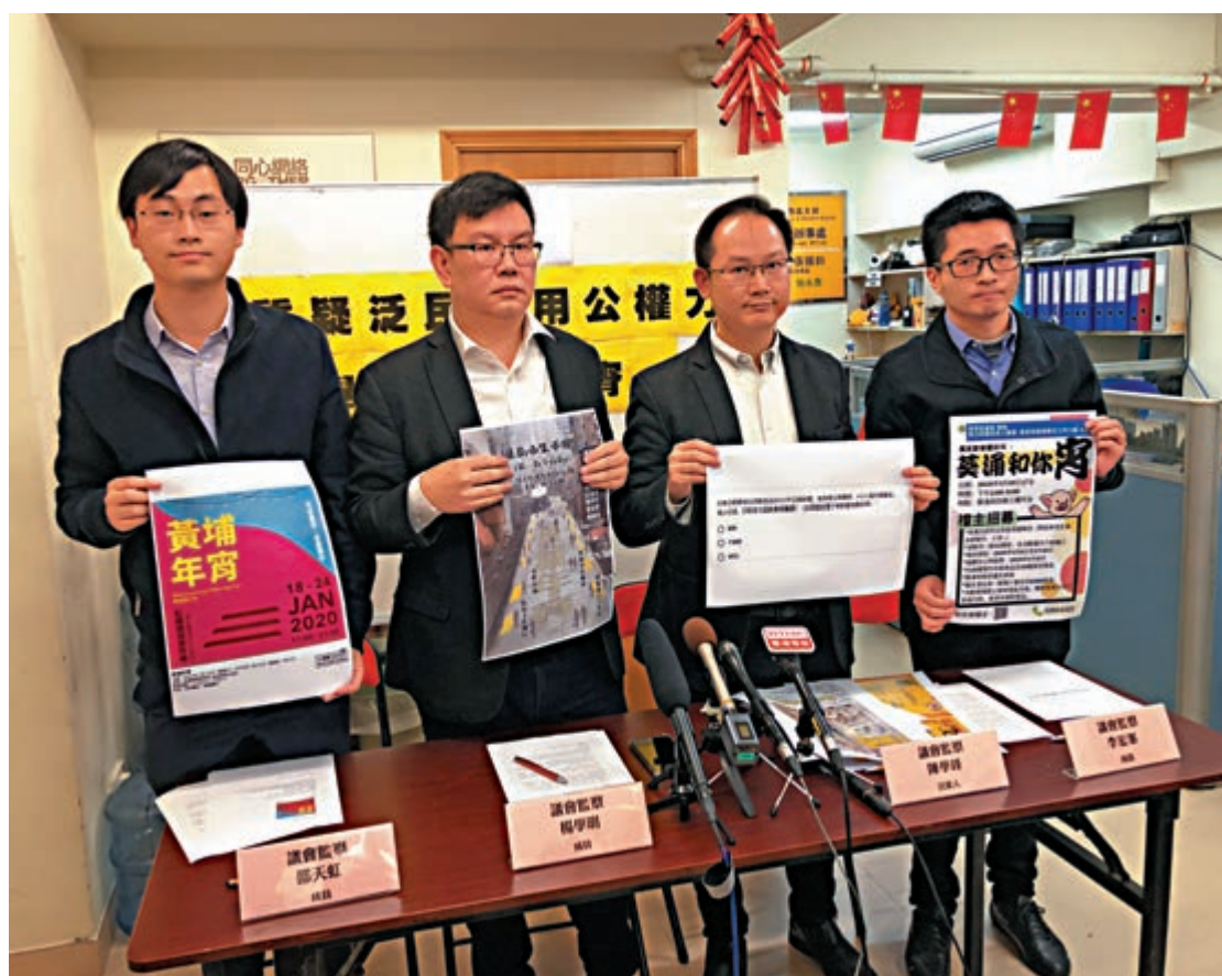
▲「議會監察」批評泛暴派區議員發起所謂的「和你宵」，濫用公權力，為政治立場服務

泛暴派區議員上任不足一個月便濫用公權力！專門監察十八區區議會議員的「議會監察」發現，有泛暴派區議員在多區發起所謂的「和你宵」活動，既滲透強烈的政治色彩，更涉嫌濫用公權力為個人或某黨派的政治立場服務，同時涉及商業活動，有利益衝突。「議會監察」還發現，有活動更未有向政府申請相關牌照，參與市民有可能誤墮法網。