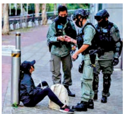
▲英國領事館遭人塗鴉，警員截查一名15歲少女，搜出一支噴漆劑，以涉嫌刑事毀壞將她拘捕

強調，在行動前有知會領事館，並一直與領事館溝通。泛暴派對於少女在英領館外被捕一事「如獲至寶」，一窩蜂地起哄，英國保守黨人權委員會委員布爾福德(Luke de Pulford)稱，對事件表示擔憂，又稱領事館容許他人進入屬地，質疑違反外交不可侵犯原則。「國際關係專家」沈旭暉聲言，香港警察未搞清楚就作出拘捕，明顯缺乏國際常識。而昨日英國領事館的回應，可謂是對着泛暴派狠狠攔了一巴！