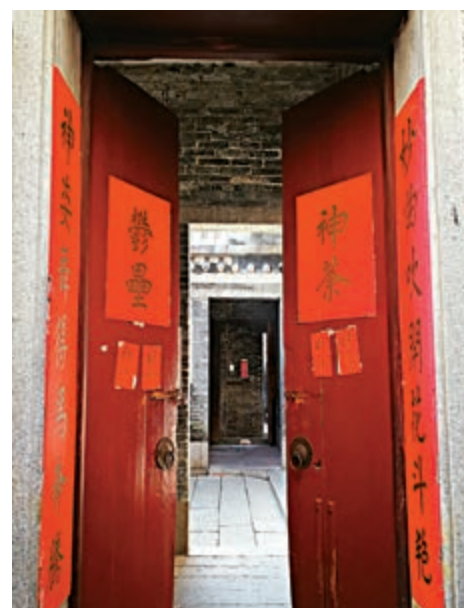
▲民宅門上貼着第一代的門神「神荼」、「鬱壘」