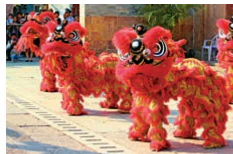
▲新年經典節目——醒獅