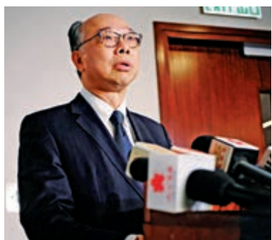
▲陳帆希望港鐵公司通車日有些安排令乘客有驚喜