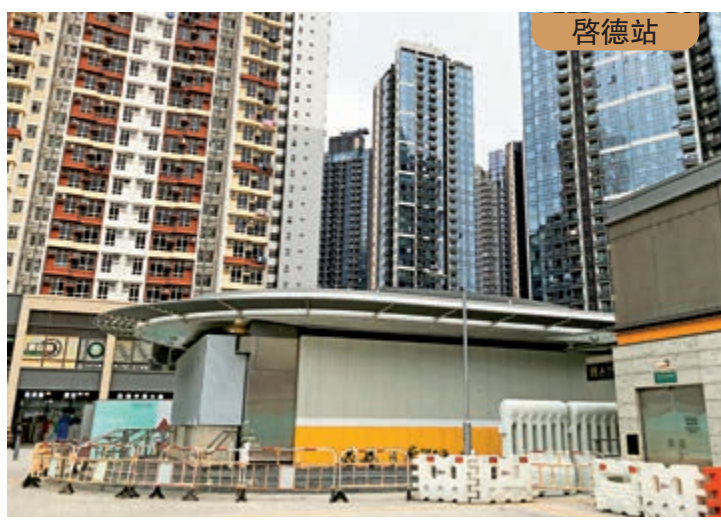
▲港鐵屯馬線一期下月「情人節」通車，啟德及顯徑兩個新車站將投入服務