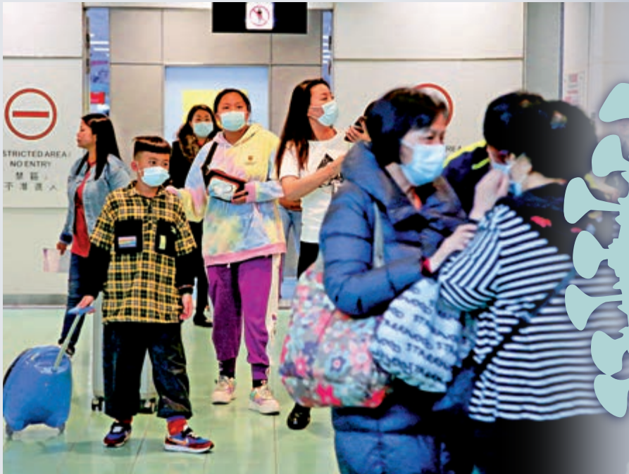
▲在上環港澳碼頭，不少出發前往澳門的旅客都戴上口罩 大公報記者攝