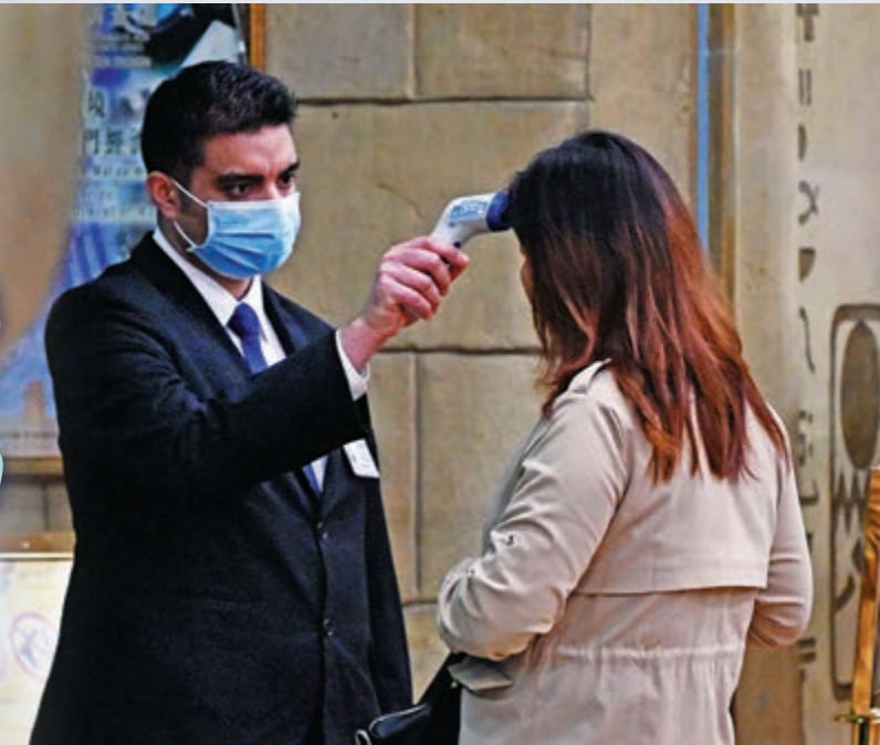
▲澳門新東方置地酒店加強防疫，有員工為入住客人量體溫

澳門出現首宗新型冠狀病毒確診個案，澳門衛生局昨日通報，患者是武漢女遊客，星期日（19日）坐高鐵到珠海，經拱北口岸進入澳門，目前隔離留醫，病情穩定。澳門市面出現搶購口罩潮，澳門當局將推出限購措施，10日內每次限購10個；採取包括建立24小時溝通機制、在口岸實施採熱和填寫入境申報表、督促博企加強娛樂場防控措施、暫停往來武漢和澳門的旅行團等措施，全力應對和防控疫情。 防控新肺炎 大公報記者 馬琳（澳門） 謝瑩瑩（香港）