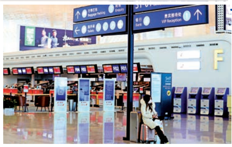
天河機場 | ▲23日，武漢天河機場旅客寥寥