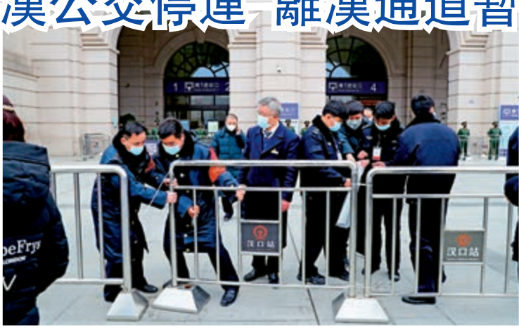
漢口車站 | ▲23日上午漢口火車站離漢通道暫時關閉