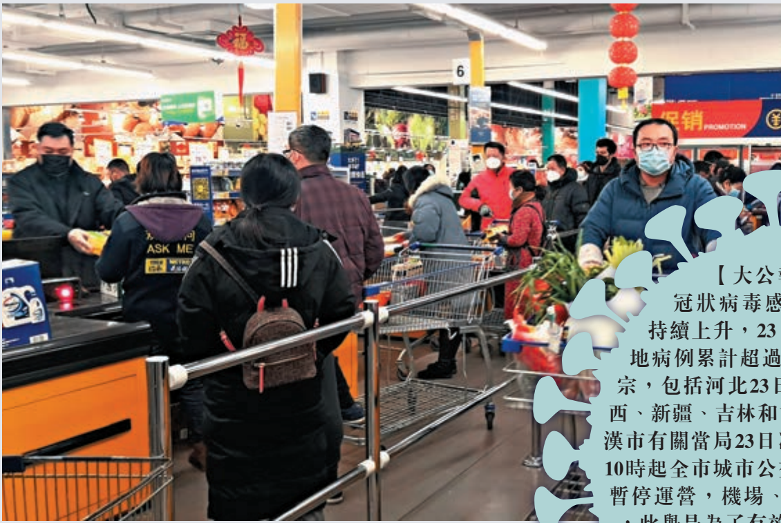
▲武漢「封城」首天，武漢漢口區麥德龍超市收銀處大排長龍

【大公報訊】內地新型冠狀病毒感染的肺炎確診病例持續上升，23日經國家衛健委確認內地病例累計超過600宗，累計死亡案例18宗，包括河北23日公布1例死亡個案。陝西、新疆、吉林和甘肅出現首例確診病例。武漢市有關當局23日凌晨發布通告稱自23日早上10時起全市城市公交、地鐵、輪渡、長途客運暫停運營，機場、火車站離漢通道暫時關閉，此舉是為了有效切斷病毒傳播途徑。世衛組織總幹事譚德塞認為「封城」將降低疫情蔓延機率，做法恰當。