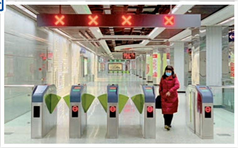
市內地鐵 | ▲23日，武漢地鐵暫停運營