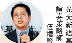
證 光 大 新 鴻 基 伍 禮 賢 策 略 師