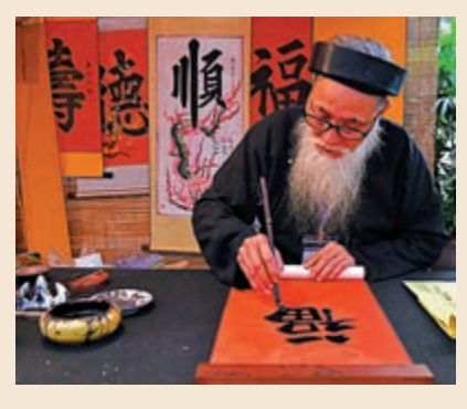
▲農曆新年傳承着許多民俗

福滿門。」這樣的對聯，我很小就琅琅上口了。是父親逐個字教會我們的，卻從來沒有解釋字面上的意思，他一定是認為解釋了也沒有用，他認定我們不懂。這也就是說，從小到大，我們年年都看到這樣的對聯，從不知所云到完全懂得它的意思，還真的需要花上一些年月。 日子在流逝，天越來越老，但是人不是老去，而是更加長壽了——這是多麼好的吉利話啊。 所以到了現在這個歲數，我仍然喜歡過年。年的腳步越來越近，我就一天忙起來；雖然屋子並不髒，但總得抹抹玻璃窗，洗換一下窗簾什麼的。除此年夜飯要弄些什麼新菜式，都得預早計劃好；什麼食材該先買，什麼留到最後……還有封利是錢，得預先找好新鈔。而所謂的辦年貨，也包括禮尚往來的禮品，這些都得花心思。對了，還得為小朋友們預備荷蘭水。不過不是玻璃瓶裝的而是盒裝的果汁——聽說利賓納黑加侖子汁也有了氣體包裝的，裏面有「波波」，大受小朋友歡迎。