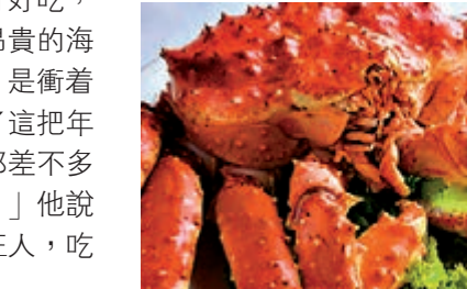
▲日本北海道盛產帝王蟹

草不生，聽說那裏很安靜，冷得要命，冬天就算在市區，也難找一個問路人。沒想到北海道竟是日本人的糧倉、林場、牧場、漁港。土地寬廣，種植業發達，每戶農家有土地少則十幾畝，人跡稀少處好幾十畝甚至更多。漁業，是北海道的大型產業。 粵港澳的居民對海鮮情有獨鍾，逢年過節，送禮以海鮮為上品，請客吃飯，沒有海鮮不成檔次。旅行如果到日本，買海鮮吃海鮮，逛逛海鮮市場，是很多人的必然節目。