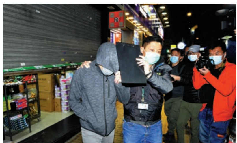
▲海關在行動中拘捕藥房一名二十七歲男負責人