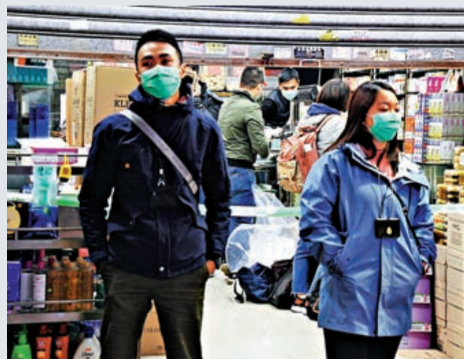
▲海關接獲舉報，派員到涉事藥房調查