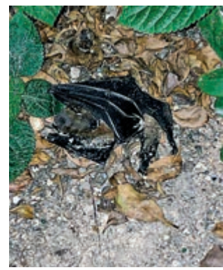
▲石硤尾邨對開花槽發現一隻約成人手掌般大小的蝙蝠屍體

2003年沙士疫情病毒源自中華菊蝠，鑒於近日肆虐的新型肺炎的冠狀病毒，與當年沙士病毒甚為相似，故有專家估計新型肺炎的病毒，有相當可能是源自蝙蝠，現時新型肺炎病