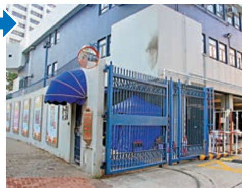
▲紅磡警署車間外牆熏黑