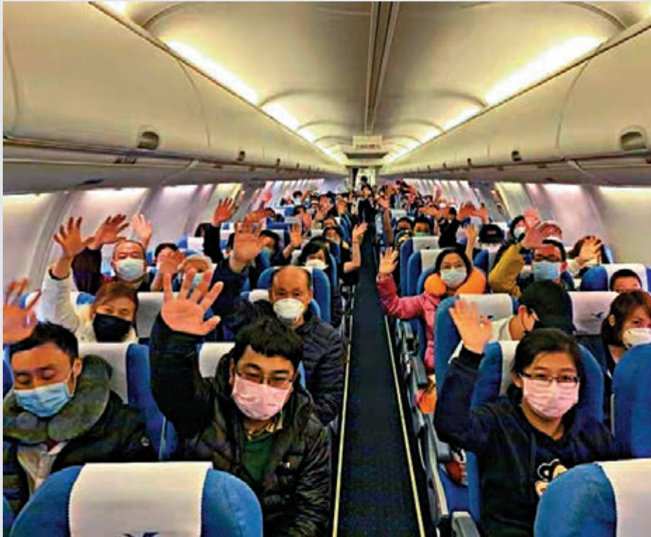
▲在馬來西亞沙巴機場，旅客們完成登機，準備起飛