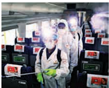
▲工作人員對動車組車廂進行消毒

【大公報訊】綜合央視新聞、記者周琳、盧靜怡報道：國家衛健委高級別專家組組長鍾南山2日對媒體指出，新型冠狀病毒有可能通過糞口傳播，應予以重視。