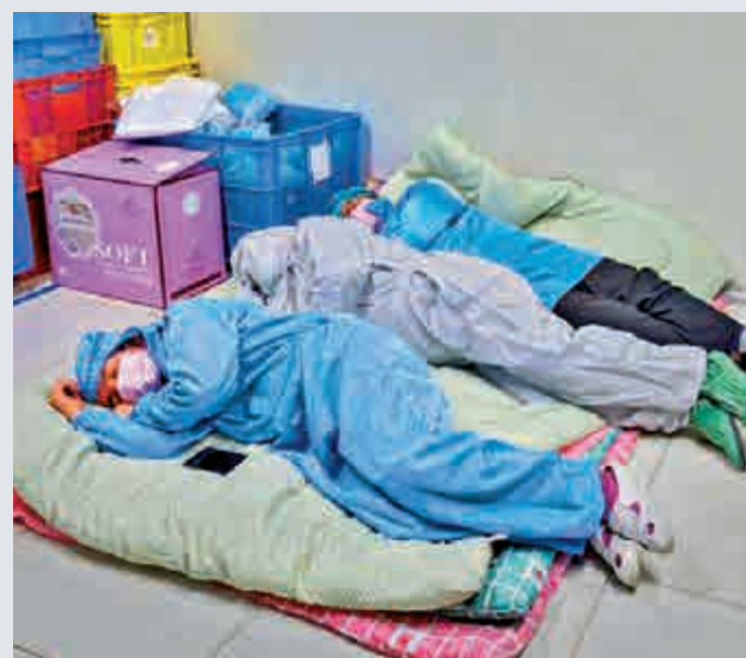
▲新綸科技的員工以廠為家，席地而睡