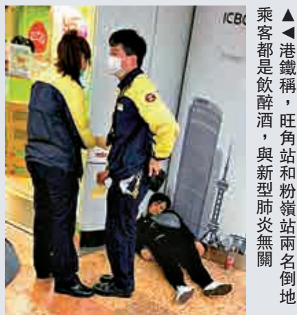
▲港鐵稱，旺角站和粉嶺站兩名倒地乘客都是飲醉酒，與新型肺炎無關