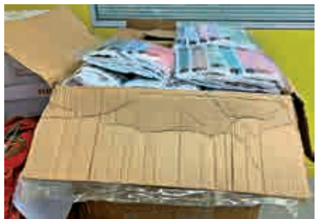
▲社區組織協會獲商界捐贈口罩，近日轉送會員及有聯繫的基層組織

社區組織協會稱，前日已收到來自信和集團的9000個口罩，並分發至協會的三個社區中心，本周內安排會員及有聯絡的基層家庭領取。