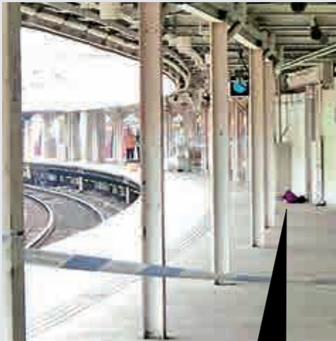
▲羅湖站月台發現懷疑爆炸品，警方將現場封鎖