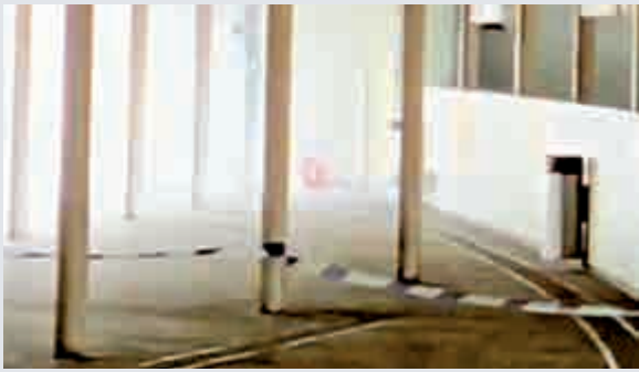
▲爆炸品在月台上突然起火，散發大批濃煙