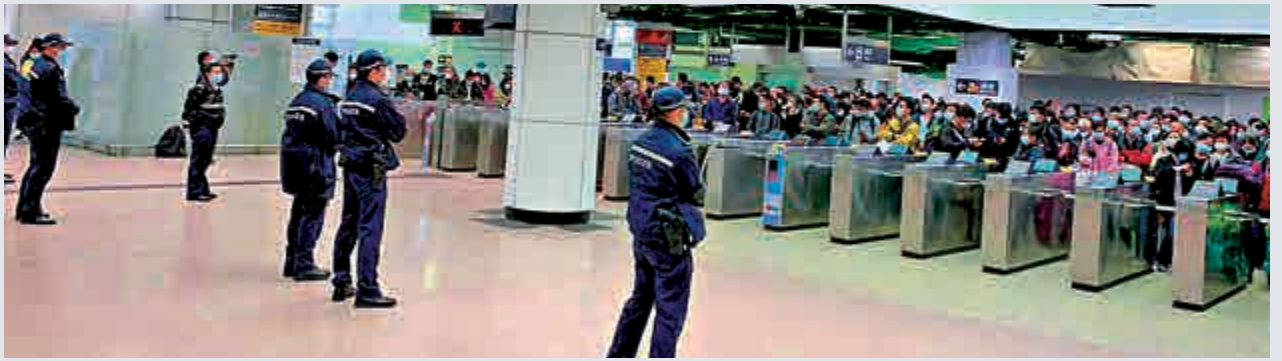
▲警方封鎖羅湖站調查，現場大批市民等候入閘 網上圖片