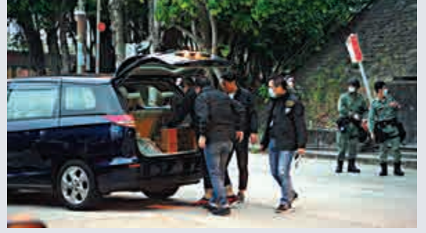
▲警方爆炸品處理科調查後，將部分爆炸品證物帶署調查

有組織罪案及三合會調查科（O記）警司布振權表示，昨午3時10分，一列由九龍開往駛至羅湖站的列車，一名女清潔工人在東鐵列車車廂的櫈底，發現一個環保袋，懷疑是乘客遺下，遂帶往月台員工室外，由另一職員打開袋內查看，赫見有電線捆着一圓柱物體，察覺有可疑，迅即報警求助。