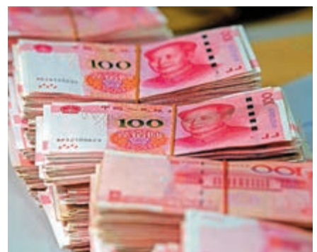
▲市場人士認為，短期人民幣繼續維持偏弱水平

他稱，新型肺炎帶來的不確定性在一定程度上已反映在人民幣匯率當前的走勢中，未來還需要評估疫情的下一步發展及其產生的實質性影響。