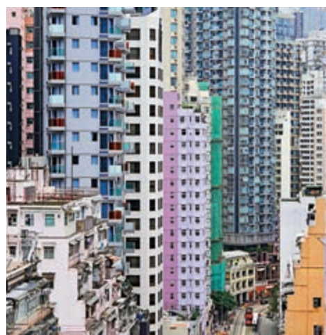
▲1月份現樓按揭宗數為5054宗,較去年12月回落20.9%,創三年來新低

【大公報訊】根據經絡按揭轉介研究部及土地註冊處最新資料顯示,2020年1月份現樓按揭宗數為5054宗,較去年12月回落20.9%,創三年來新低。1月樓花按揭宗數為1109宗,上升16.5%。以按年比較,1月份現樓按揭宗數按年大幅下跌40.5%;樓花則下跌9.02%。