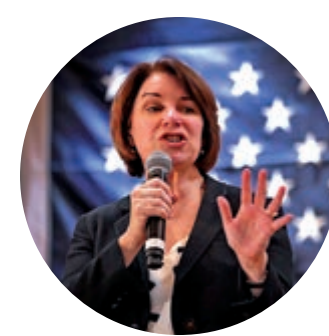
民主黨參議員克洛布徹