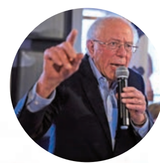
民主黨參議員桑德斯