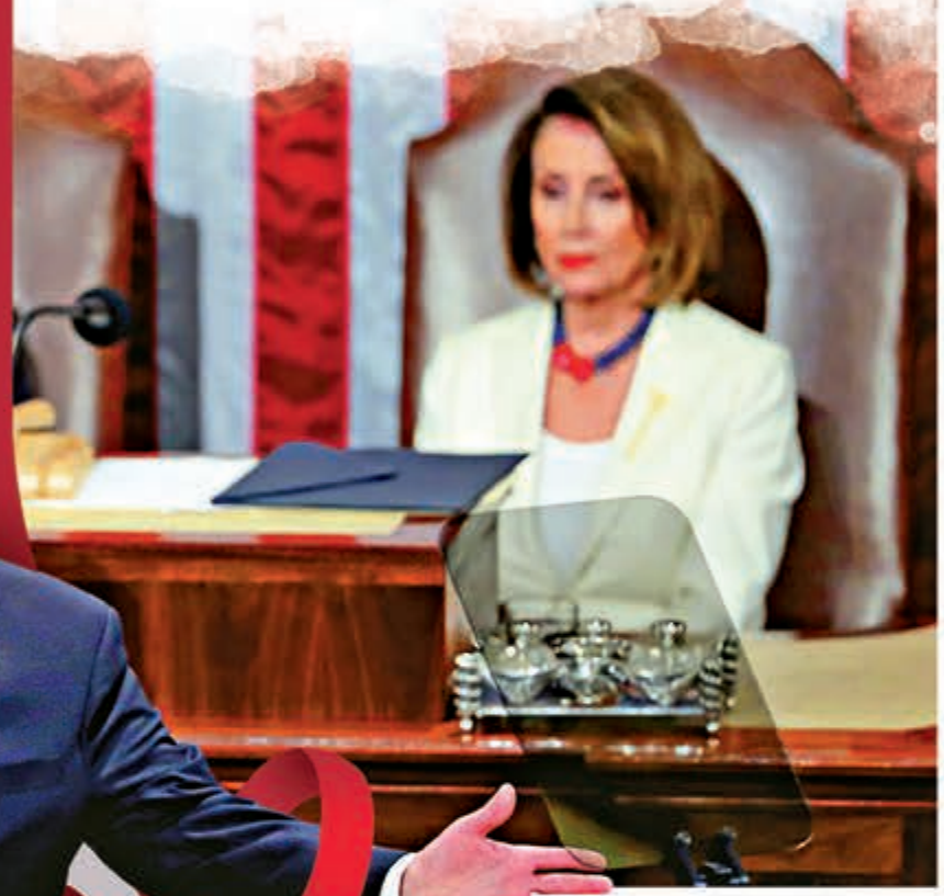
特朗普將於4日發表國情咨文，針對他的彈劾案預計5日有定論