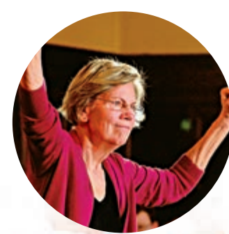
民主黨參議員沃倫 路透社