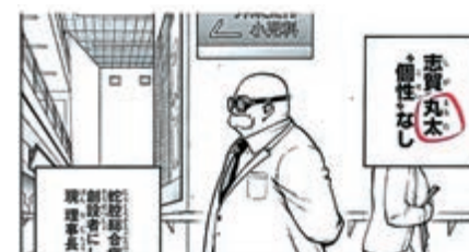
日本漫畫《我的英雄學院》被曝出現辱華字眼

雖然刊登該漫畫的《周刊少年Jump》及時發布聲明，稱沒想到「志賀丸太」會讓人聯想到過去的歷史，強調在命名時作者及編輯部均無辱華之意，但作者掘越耕平的推特回應並未道歉。據悉Jump已與掘越耕平商量決定更改此角色的名字，但粉絲並不買帳，不僅是中國讀者，韓國、日本粉絲也開始抵制這部作品。