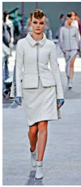
►Gucci今季設計回歸簡約