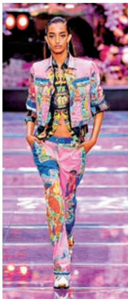
►色彩斑斕的春季服裝