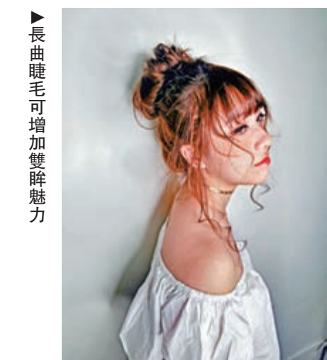
►長曲睫毛可增加雙眸魅力