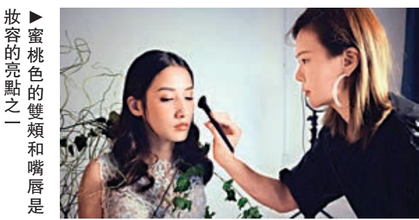
►蜜桃色的雙頰和嘴唇是妝容的亮點之一