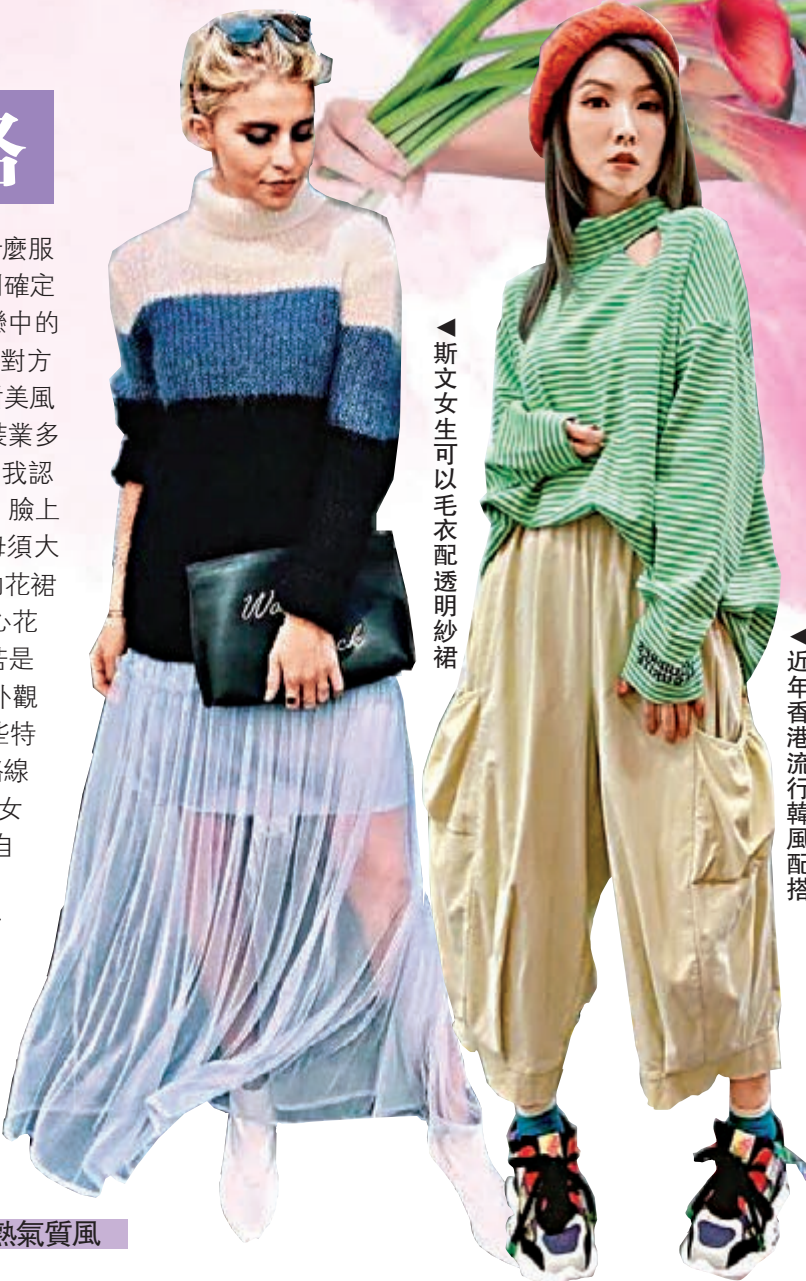
►斯文女生可以毛衣配透明紗裙