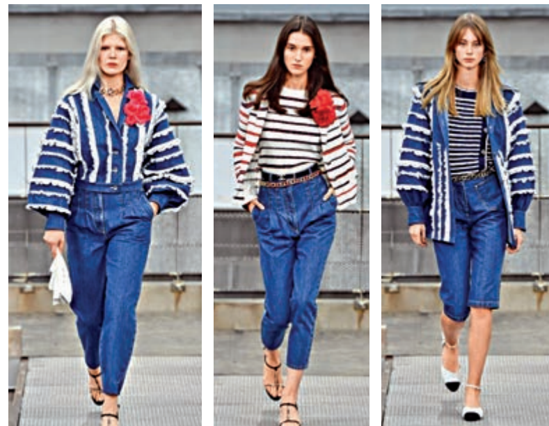
►Chanel今春以牛仔元素作服裝主題

Gucci今春服飾主軸是「極簡」，似乎打破了外界對品牌設計風格貫有的印象。性感曾經是Gucci的代名詞，模特兒分別穿上半身薄紗透膚的黑色洋裝，領口極低的長洋裝，裙襬開高衩的設計，權威感的劍領西裝剪裁，象徵控制、支配意味的皮鞭，膠感手套、子彈造型的唇膏套等。新一季可以看到品牌許多過去風靡一時的設計元素，再度被發揚光大，穿上本季的Gucci，依然可以讓人們做個不一樣的自由美夢，或是努力成為獨特的自己。