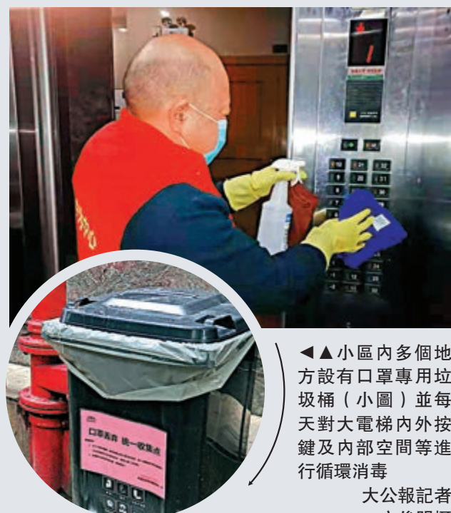
小區內多個地方設有口罩專用垃圾桶（小圖）並每天對大堂電梯內外按鍵及內部空間等進行循環消毒 大公報記者 方俊明攝

位於廣州天河區的華景新城僅留一個進出口，其他暫時封閉。戴口罩的保安為出入居民測量體溫，而外賣、快遞、送水等人員不能進入小區，由住戶戴口罩下樓自行領取；而小區多個地方都設口罩專用垃圾桶。華景物業管理負責人稱，由於小區外地業主較多，所以門崗還要對春節後返穗人員進行逐一登記，包括提供車船票及飛機票等憑證。