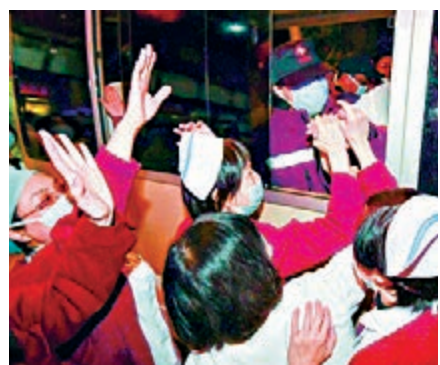
福建「方艙車隊」出發馳援武漢

據悉，「方艙醫院」一般由醫療功能單元、病房單元、技術保障單元等部分構成，是一種模塊化衛生裝備，具有緊急救治、外科處置、臨床檢驗等多方面功能，在各種應急救治、部隊野戰醫院等領域廣泛使用。