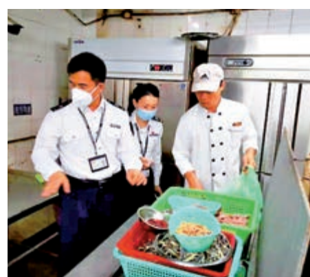
深圳市市場監督管理局開展野生動物交易排查 資料圖片

同日，在大鵬南澳雙擁碼頭海鮮街，檢察人員發現名順海鮮檔海鮮池擺放有2隻鱉，屬於廣東省重點水生野生保護動物，執法人員立即拍照取證並現場放生，目前已立案調查。