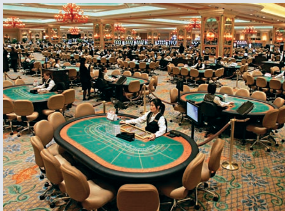
▲為防控新型肺炎，澳門政府宣布賭場停業15天