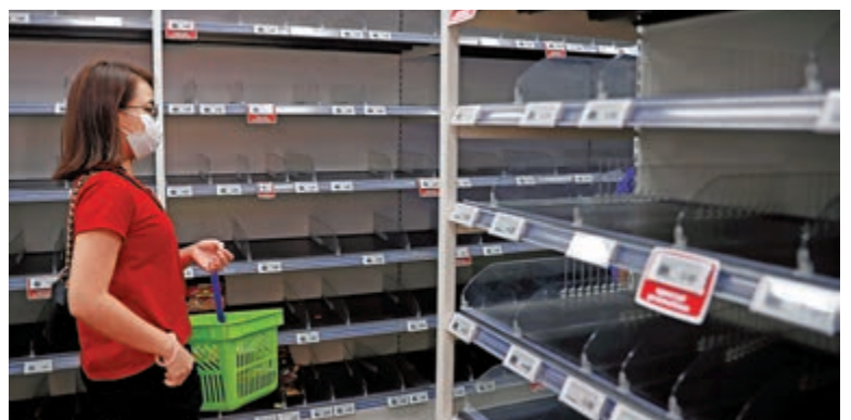
▲新加坡一間超市內的多個貨架上的食物已被搶購一空

鄭泳舜稱，8日曾聯絡入境處，獲告知部門的協助居民小組已投入支援。因應事情緊急，鄭泳舜要求當局尋找中國大使館幫忙，對這批港人旅客在多方面支援，包括醫療方面，如有需要或考慮派員運送相關醫療物資。