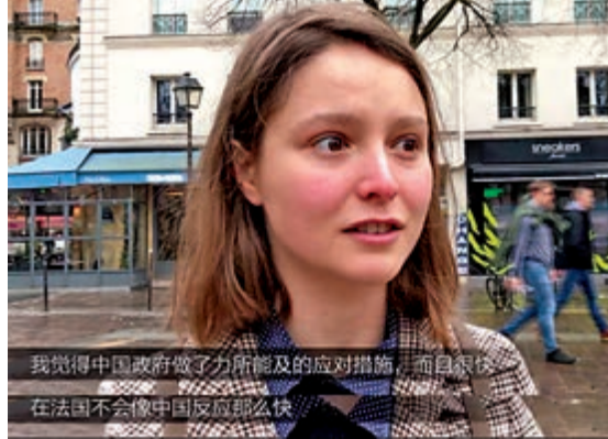
▲法國友人譴責歧視華人的言論

【大公報訊】綜合大文國際拍客、中新社、新華社報道：受新冠肺炎疫情影響，不少海外華人乃至亞裔人群受到不公對待。面對少數國家個別人和媒體連續出現不友善甚至辱華仇華言行和暴力個案，有網友在推特上發起「我不是病毒」活動，多國主流媒體和輿論也紛紛譴責以疫情為藉口的種族歧視行為。