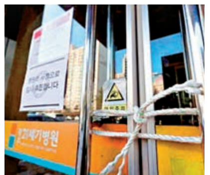
▲光州21世紀醫院4日起封院隔離《朝鮮日報》