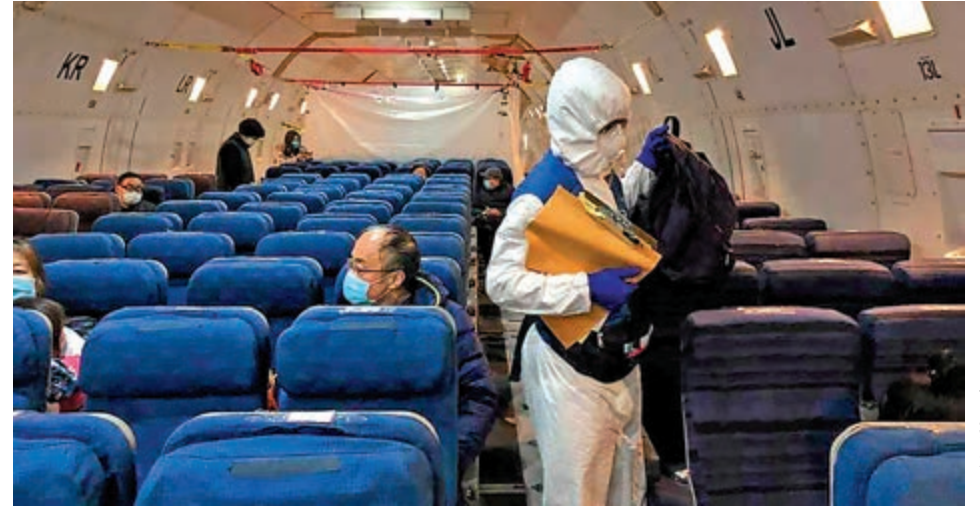
◀美國大使館的職員在撤僑專機內檢查