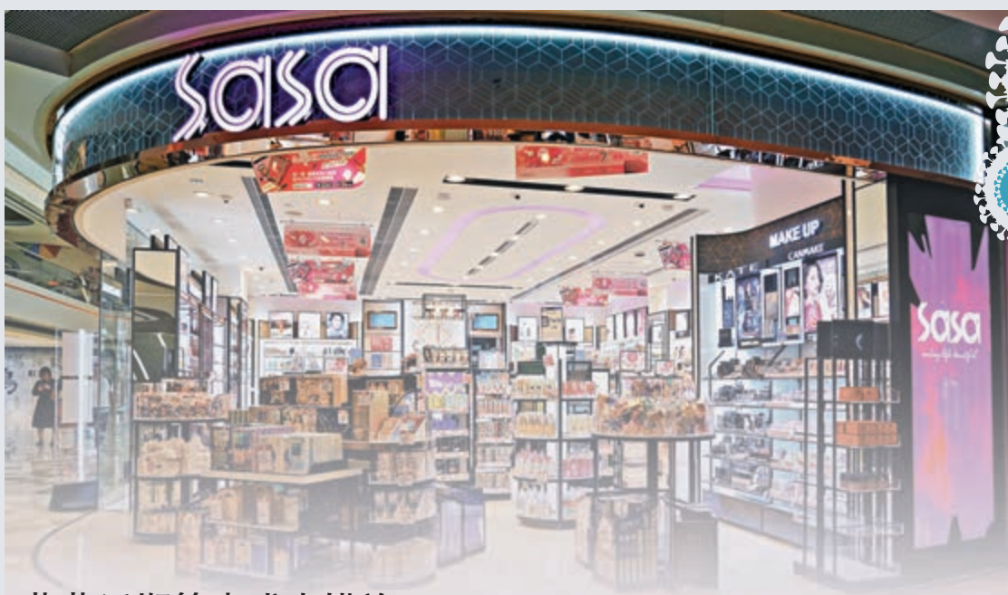
莎莎宣布，考慮到現時顧客消費需求減低，旗下香港及澳門合共21分店將暫時停止營業