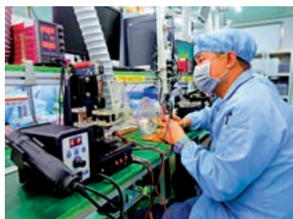
▲東莞全市已有4491家企業開工，其中製造業佔79.54%