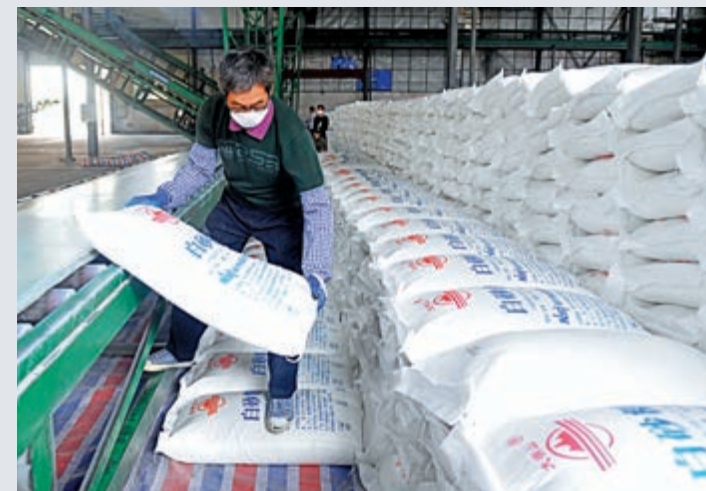
▲在廣西南寧糖業賓陽大橋製糖有限責任公司，工人在生產作業中