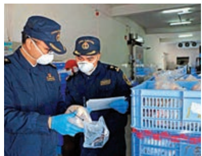
▲清遠海關關員對供港冰鮮清遠雞進行監裝，檢查核對貨物信息