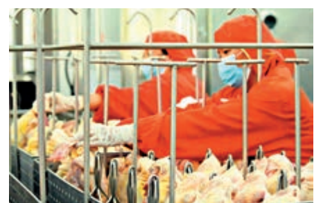
▲在廣州江豐實業股份有限公司生產車間，工人對供港雞隻進行加工

區靜待約2-3小時，然後再屠宰、包裝。曾憲軍說，所有產品運送到香港之前，都將經過五次安全檢測、三次官方關於藥物殘留和疫病方面的檢測，確保供港食品的安全。