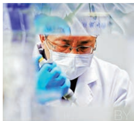
▲上海科研人員展示新型冠狀病毒mRNA疫苗研發實驗過程

【大公報訊】記者劉凝哲北京報道：國家科技部生物中心主任張新民15日表示，疫苗研發是新冠肺炎科技攻關的重中之重，正在實行「掛圖作戰」。目前，包括滅活疫苗、mRNA疫苗、重組蛋白疫苗、病毒載體疫苗、DNA疫苗等正並行推進。中科院微生物所研究員嚴景華表示，該團隊研究的重組蛋白疫苗已完成設計，正在動物體內進行測試。