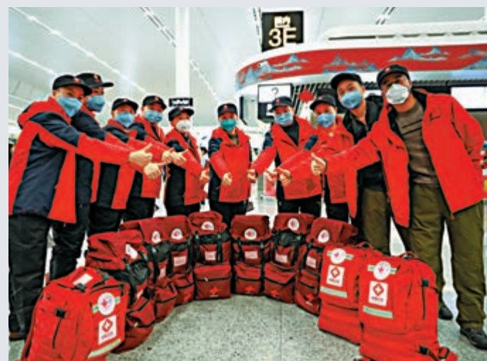
▲15日，重慶市第九批支援湖北醫療隊從重慶江北國際機場出發，100名醫護人員將支援武漢抗擊疫前線