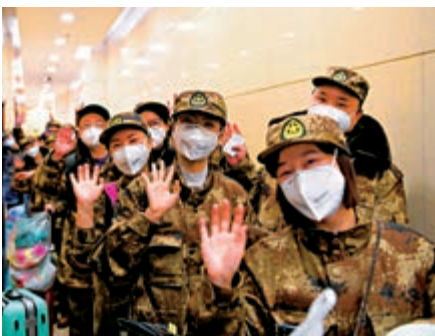
▲13日，在成都雙流國際機場，四川284名醫療隊員準備出發馳援湖北