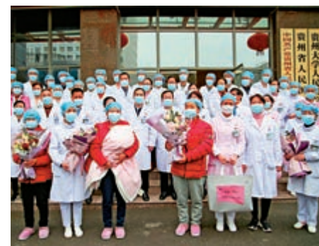
▲15日，貴州省人民醫院收治的4名新冠肺炎患者達到解除隔離治療標準，同時出院

合，湖北地區一半以上的重症病例使用了中醫藥治療。在湖北省以外地區，據國家衛健委介紹，2月14日，重症病例減少25例，重症病例數連續5日減少。