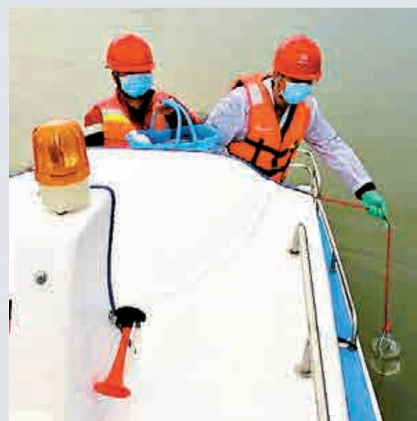
▲工作人員加強原水水質監測 受訪者供圖 ◀粵港供水總調度中心24小時值班，實時監控東深供水工程運行情況 受訪者供圖

「供水公司在1月23日就成立防疫工作應急領導小組和工作小組，並制定防疫信息排查、信息報告和應急值班等制度。」廣東省水利廳有關負責人表示，為切實做好疫情防控工作，供水公司根據行業實際和防控工作需要，制定了6個預案或者方案，全面構築嚴密防控網絡，確保供水安全。