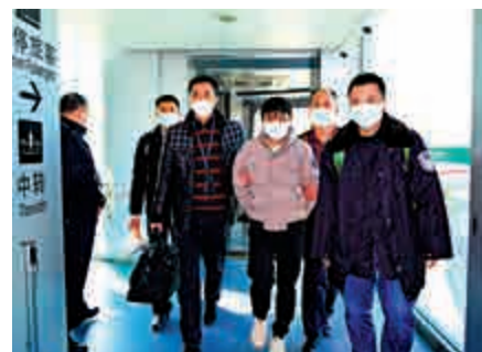
▲廣東警方抓獲涉疫情詐騙犯罪嫌疑人

對於拒不配合的，警方將依法予以打擊。廣東省公安廳在發布會上透露，1月25日至2月14日，廣東警方查獲涉及疫情的違法犯罪案件3400多起，抓獲3700多人，其中，查處抗拒疫情防控措施犯罪案件39起。廣東省公安廳刑偵局局長梁瑞國表示，確診患者不配合隔離治療，公安機關會直接採取措施，追究其以危險方法危害公共安全罪責任。疑似患者也要配合檢查，否則將採取強制措施送醫治療，事後刑拘留。