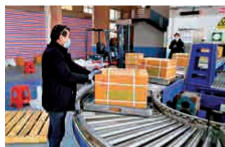
▲華大生物輻照車間工人在給物資做輻照滅菌