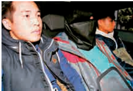
▲一名男子涉嫌爆竊佐敦道商廈診所，被警方拘捕

【大公報訊】記者黃慶輝報道：自今年初起，警方留意到西九龍涉及商業樓宇的爆竊案有上升趨勢，西九龍總區刑事總部探員經深入分析和部署，前日在佐敦及油麻地一帶反爆竊行動，其間拘捕一名正在犯案的五旬漢。經警方調