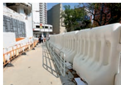
▲駿洋邨被大型水馬重重包圍