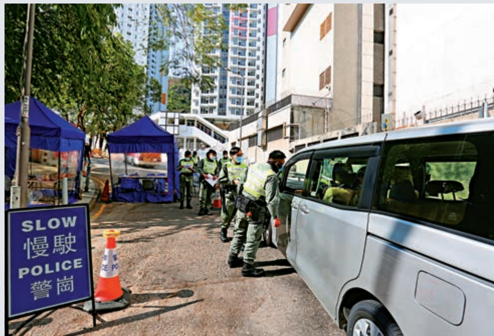
▲所有出入駿洋邨的人及車輛，必須登記資料接受警方檢查

火炭駿洋邨將用作隔離鑽石公主號郵輪上的返港乘客，特區政府表示一切準備就緒。大公報記者昨到屋邨直擊，現場守衛森嚴，每個出入口均架設大型水馬，並有警員駐守，其中各座大廈地面圍門用鐵皮包裹，從外面不能窺視到大堂內的情況。單位水電已接駁完成，部分已配備床鋪、枱椅等。屋邨與民居相距甚遠，最近的工廠大廈也超過百米距離。有保安員稱「唔擔心得咁多」，「總要有地方做隔離，度度唔得咁仲危險」；亦有準住戶認為抗疫為先，指將屋邨開作檢疫中心「有其必要」。