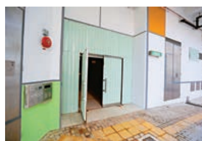
▲大廈地面圍門被淺綠色鐵皮包裹，從外面無法窺視到大堂內情況