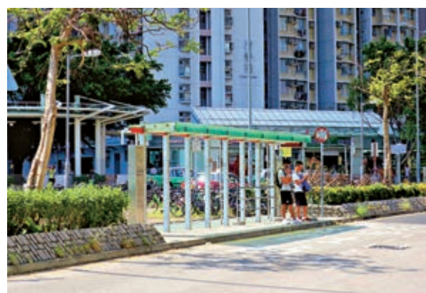
▲涉事老翁最後在上水清河邨巴士總站下車

由於老翁曾透露自己正接受隔離，同車乘客聞言大為驚恐，並通知車長報警求助。警方最終在清河邨巴士總站截獲老翁，並通知衛生署派員送返住所繼續家居隔離。涉事九巴事後亦駛回車廠消毒清潔。