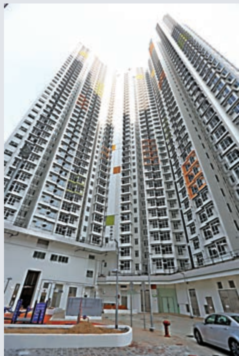
▲火炭駿洋邨將用作隔離檢疫中心