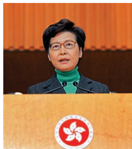
▲林鄭月娥表示，駿洋邨是目前的唯一選擇，希望市民諒解

林鄭月娥表示，特區政府正在鯉魚門公園度假村內以組合建築方式加建檢疫單位，八鄉少年警訊中心改建工作也在進行中，政府亦正物色空置土地設立檢疫設施，但建設需時，這些工作在二月底前無法完成，駿洋邨是目前的唯一選擇。她說，自公布駿洋邨用作檢疫中心後，政府已展開全面戒備，以免早前另一擬作檢疫中心的粉嶺明輝邨遭破壞之事再發生。