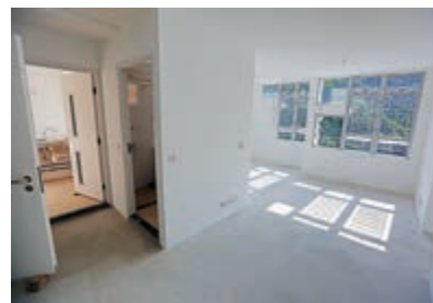
▲單位內水電已完成接駁

政府真係識揀地方，唔觀唔做檢疫中心，但我認為而家疫情嚴重，屋邨開作檢疫中心有但必要，社會各界應該顧全大局，支持政府決定。我唯有繼續等，希望政府酌情發放津貼幫助我們。