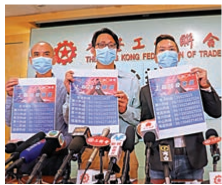
▲工聯會最新接獲623宗滯留湖北的港人求助個案

此外，工聯會自接受香港特區政府委託，義務協助受疫情影響而滯留在廣東和福建省的港人郵寄醫生處方藥物，截至昨日短短兩天共接獲465宗市民查詢和登記。工聯會表示，將盡快開展郵寄藥物行動，及時把藥物送到市民手上，以舒緩滯留內地港人缺藥的燃眉之急。如需要郵寄醫生處方藥物的港人，請致電工聯會內地中心熱線電話（3652 5833）預約及登記，服務時間上午九時至晚上十時。