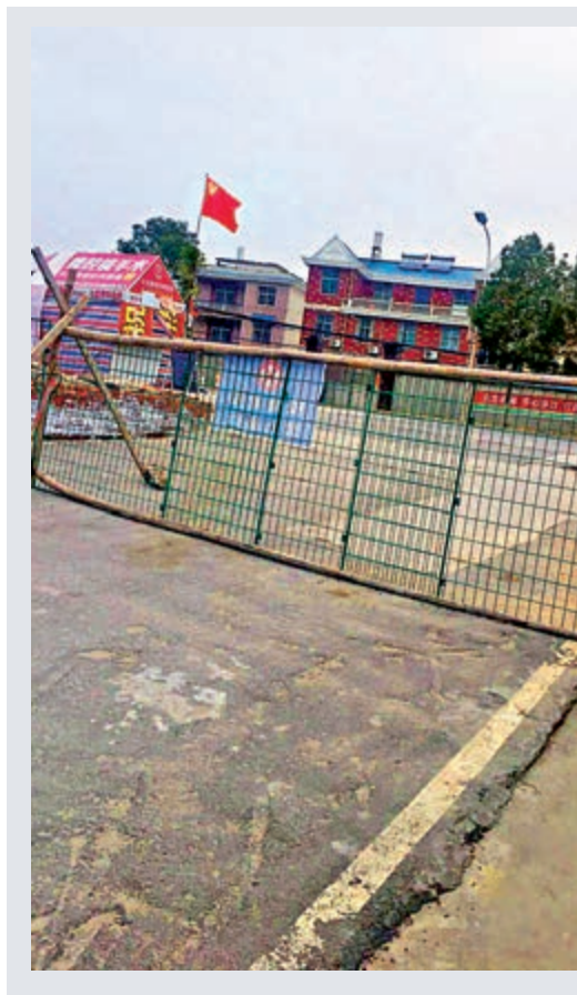
▶侯女士所在的村子管制非常嚴格，所有人不得出村，街道上也不見有人