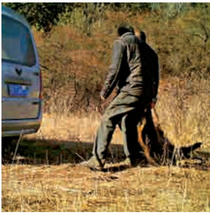
▲不法分子正在將盜獵得來的野豬搬到車上