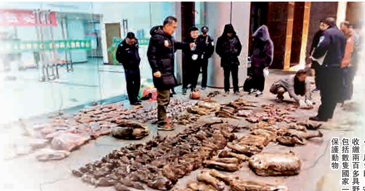
▲1月9日，安徽森林公安，收繳兩百多具野生動物屍體，包括數隻國家一級、國家二級保護動物