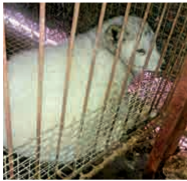
▲廣州某野味店鋪販售的狐狸