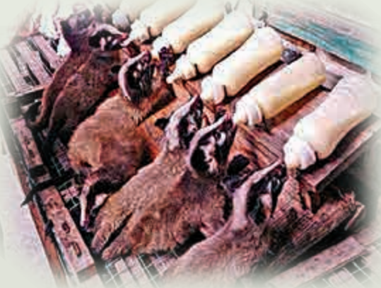
▲果子狸養殖已成為農村脫貧產業