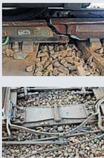
事發當日現場所見，路軌出現大條裂縫（上圖），護輪軌亦嚴重損壞（下圖）