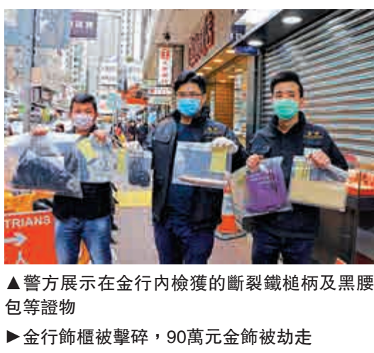
▲警方展示在金行內檢獲的斷裂鐵槌柄及黑腰包等證物 ▶金行飾櫃被擊碎，90萬元金飾被劫走

香港鐵路工會聯合會主席林偉強認同港鐵提出的五大改善建議，相信有助前線維修人員提升工作成效。他透露，據其所知，未有人因事件受懲處。