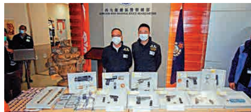
▲警方展示在割房軍火庫起獲的槍械和武器

被捕的越漢疑於六年前偷渡來港，報稱無業，租住該割房單位，闖作軍火庫及毒品貯存倉。疑犯其後報稱不適，由警員押往明愛醫院治療，案件由西九龍總區重案組接手調查，正調查越漢的背景，不排除有同黨在逃。警方經初步檢驗，相信檢獲的三支手槍是真槍。