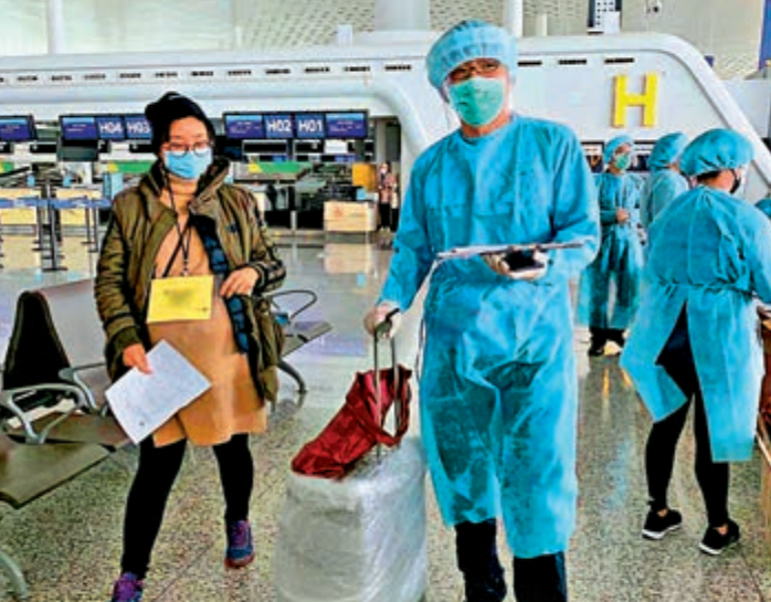
◀香港政府工作人員幫助返港乘客行李辦理手續

太太懷孕36周、獲民建聯立法會議員葛珮珊協助的陳先生表示，機場有很多政府人員幫忙安排，感到興奮，政府保護措施很好，防疫品應有盡有。住武漢武昌的阮女士說，包機安排繁複，但政府安排很細緻，同時亦感謝工聯會幫助。