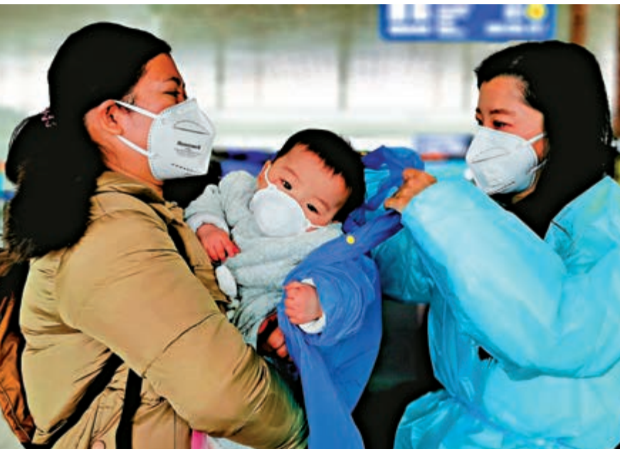
▲工作人員幫助返港乘客和BB穿戴防護服