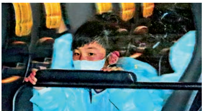
▶孩子回到香港，非常安心