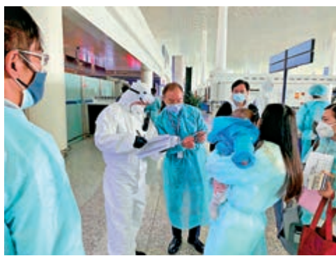
▲入境處處長主動協助機場職員加快登機流程